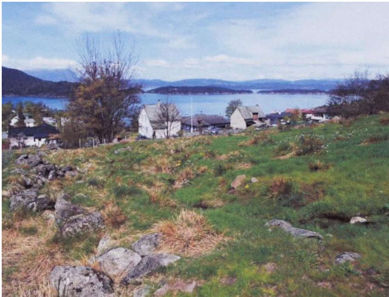
Utsikt mot vest frå det nye bustadområdet - illustrasjon i planforslaget

Onsdag skal forvaltningskomiteen behandla det private forslaget frå Erlend Bjørnebøle og Magne Huglen om bustadfeltet i Halsabrotet. Rådmannen gir positive signal om planen, som vil bety bygging av 16 einebustader og 18 husvere i tomannsbustader.