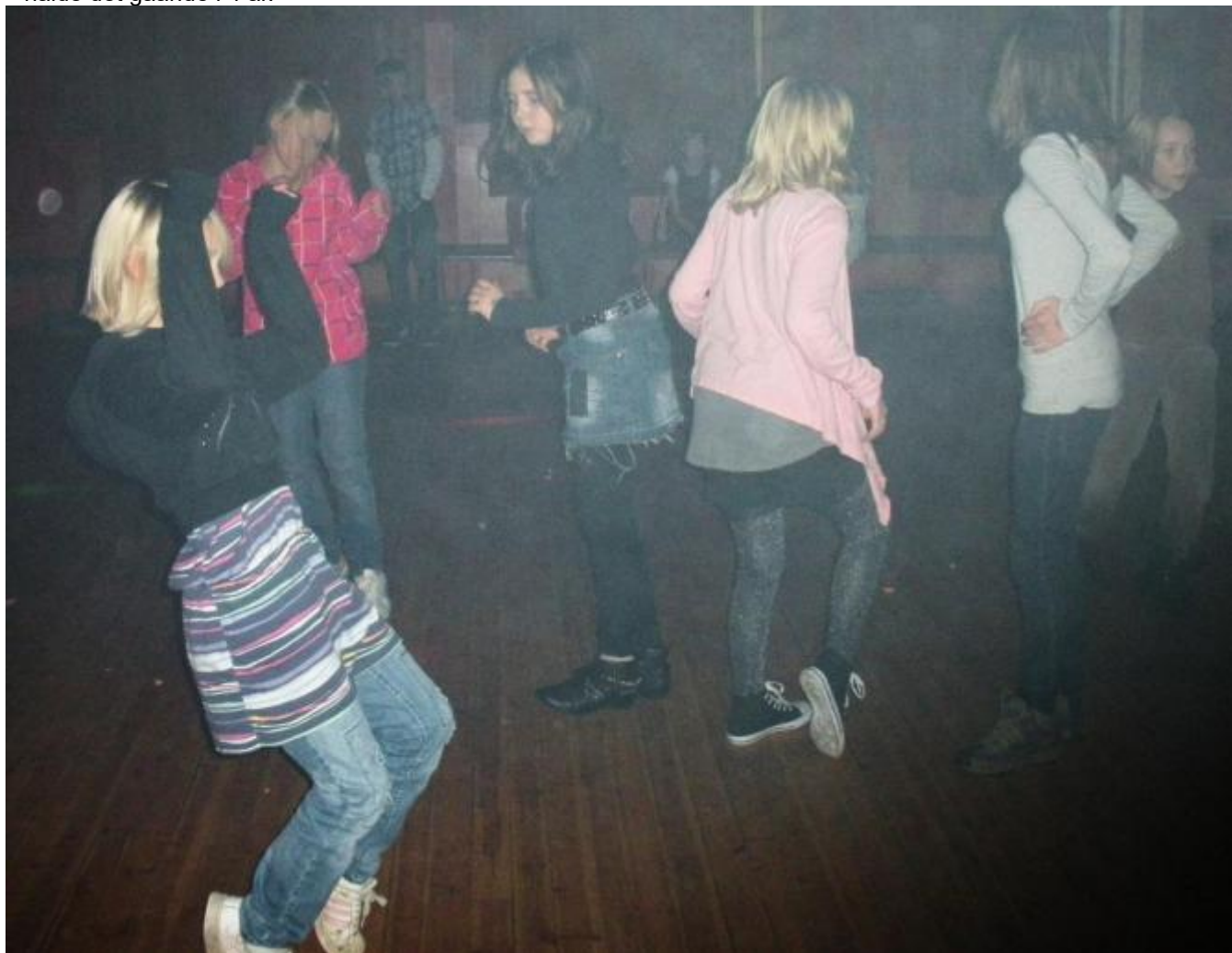
Dei eldre sviingar seg

Det er lange tradisjonar som blir ført vidare med diskoteket, men med det noverande opplegget har dei halde det gåande i 4 år.