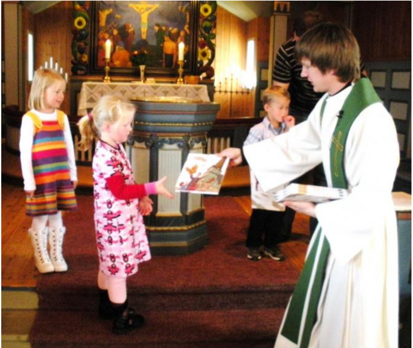
3 fireåringar får kyrkjebøker