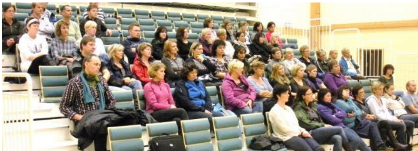
Det kom rundt 50 til lese-møtet

Å lesa er det viktigaste vi lærar eit barn, det er ein trening til å leva.