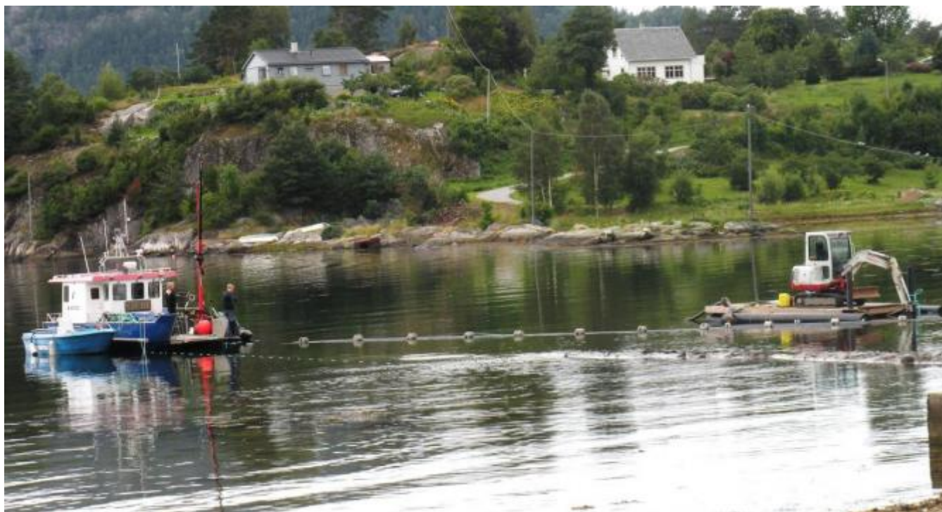
Det er stor aktivitet på Stølavikjo om dagen.

For ei veke sidan var det slutt på ferien også for Rør-Dykk og Dale Entreprenør, som har oppdraget med det store avløpsprosjektet i Uskedalen.