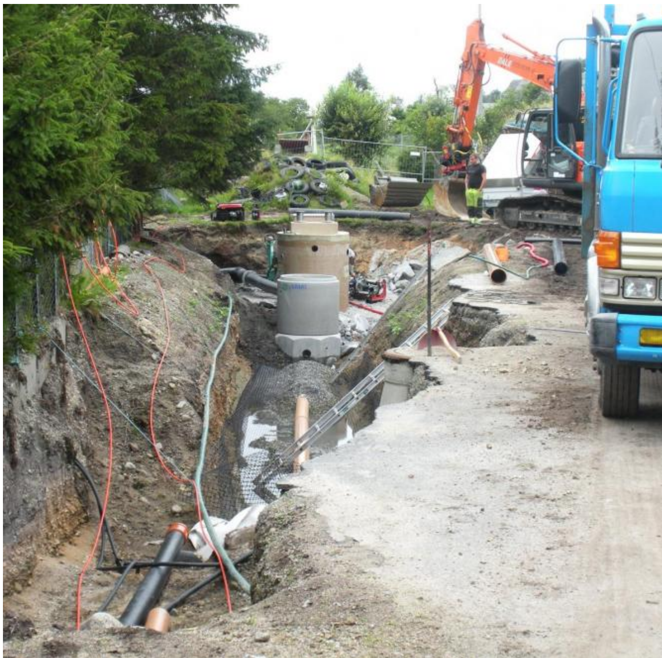
Arbeidet med pumpestasjonen pågår for fullt.

Til denne stasjonen skal det også førast kloakk heilt frå Rabben Feriesenter og denne llinken vart fullført før ferien, men det vart ikkje pumpestasjonen. Arbeidet også med den pågår framleis.