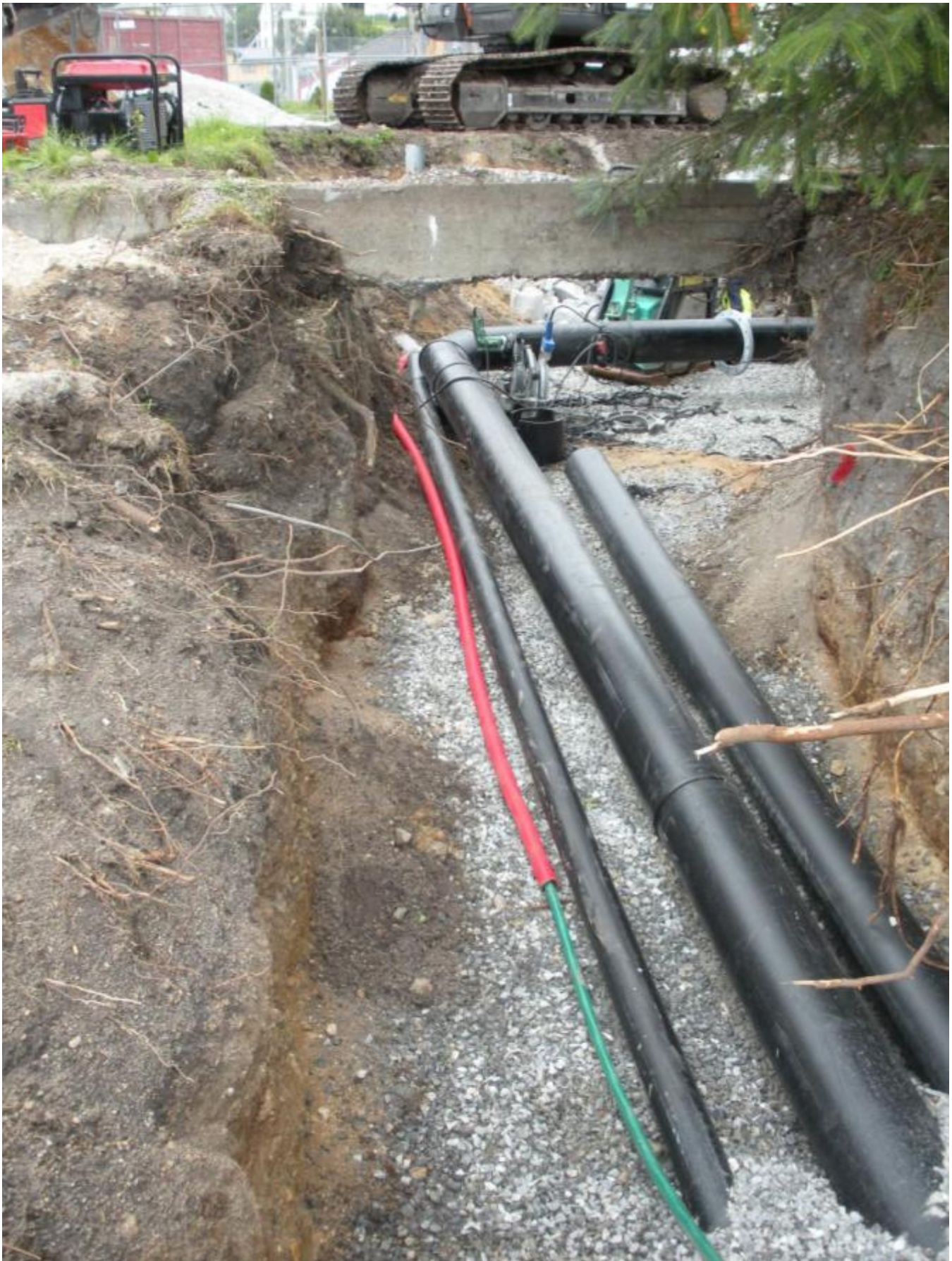
Det blir tre rør ut frå pumpestasjonen: Eitt frå Beinavikjo, eitt mot Børnes og eitt for overløp. No står mellom anna føringa av to kloakkleidningar på Stølavikjo sentralt, opplyser Sigbjørn Øye i kommunen. Ein leidning er lagt frå Uskedalen Brygge, mellom Flatholm og fastlandet og fram til pumpestasjonen. Ein leidning går frå pumpestasjonen og mot Børnes.