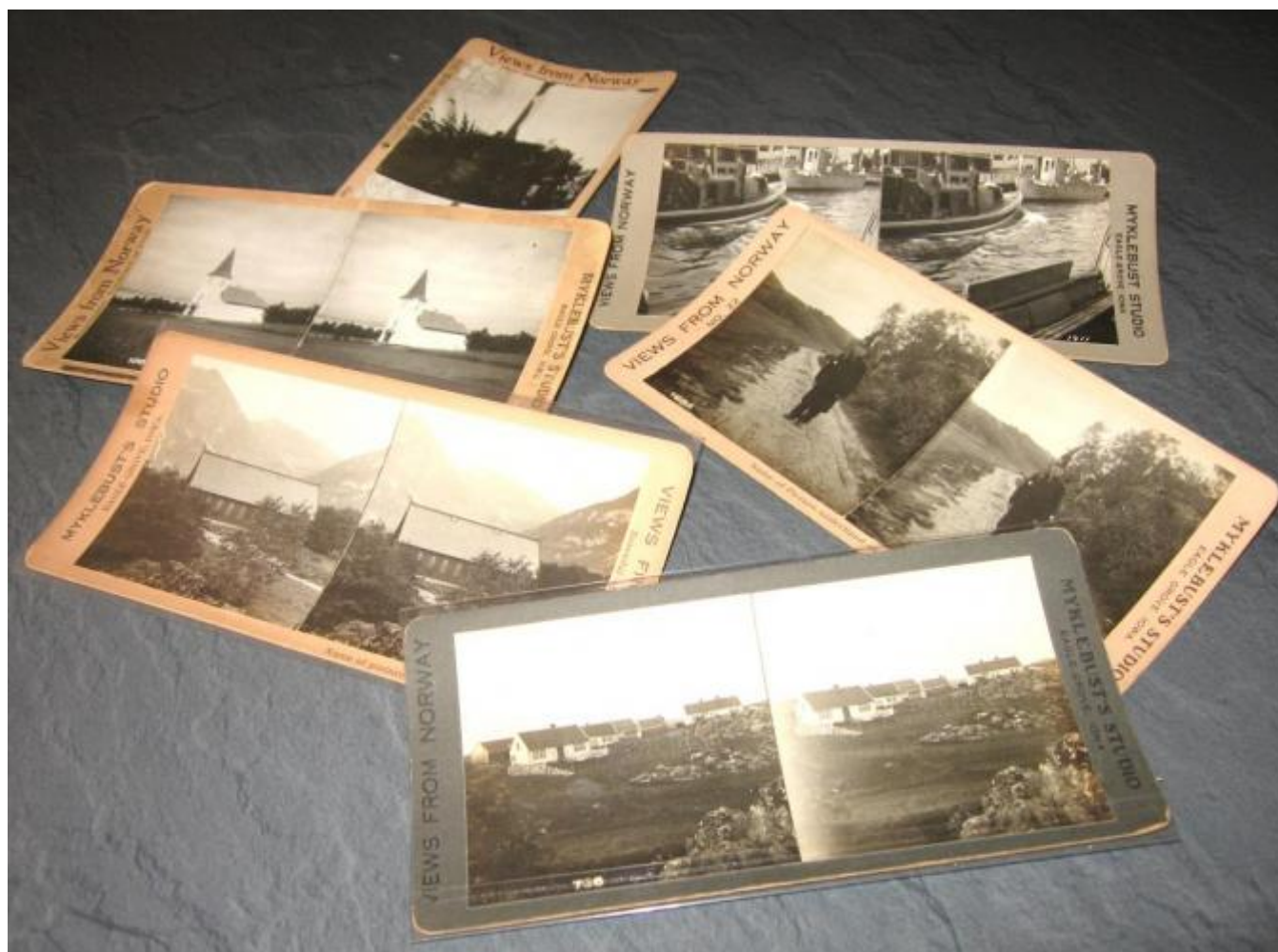
Motivgruppe 2: Fotokort - serie frå ulike bygder

Han emigrerte, utdanna seg til fotograf og starta Myklebust Studio i byen Eagle Grove i staten Iowa, USA. Nær på 20 personar har meldt frå om at dei har bilete og vil låna ut fotografi till utstillingen.