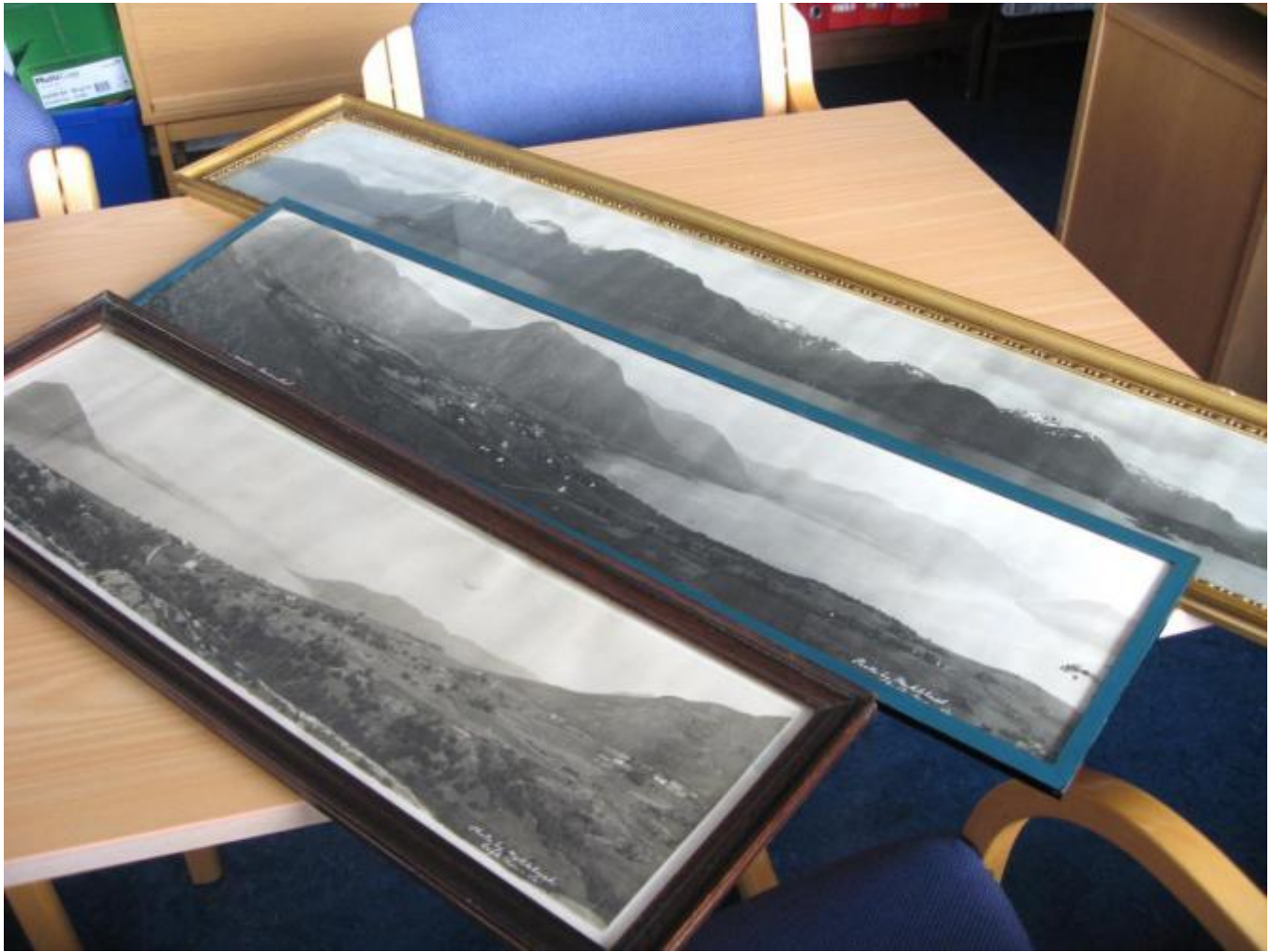
Motivgruppe 1: Bilete i breiformat - innramma

Det er stor interesse for fotoutstillingen på Rød 22. august med motiv av fotograf Kristen Pedersen Myklebust (1869 -1936) frå Uskedalen.