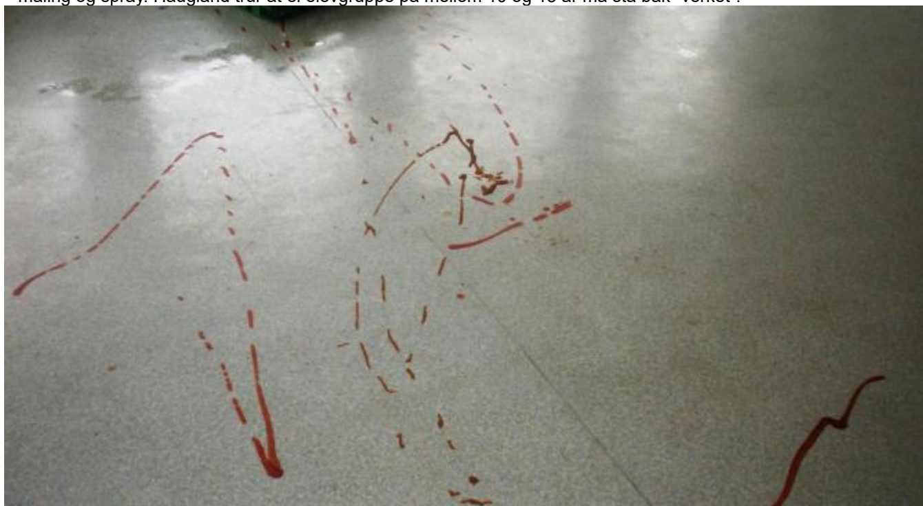
Golvet i kjøkenet er grisa til med ketsjup og vaskemiddel.

Deler av skulen, både inne og ute, er eit rystande syn etter det som har gått føre seg - særleg med hjelp av måling og spray. Haugland trur at ei elevgruppe på mellom 10 og 13 år må stå bak "verket".