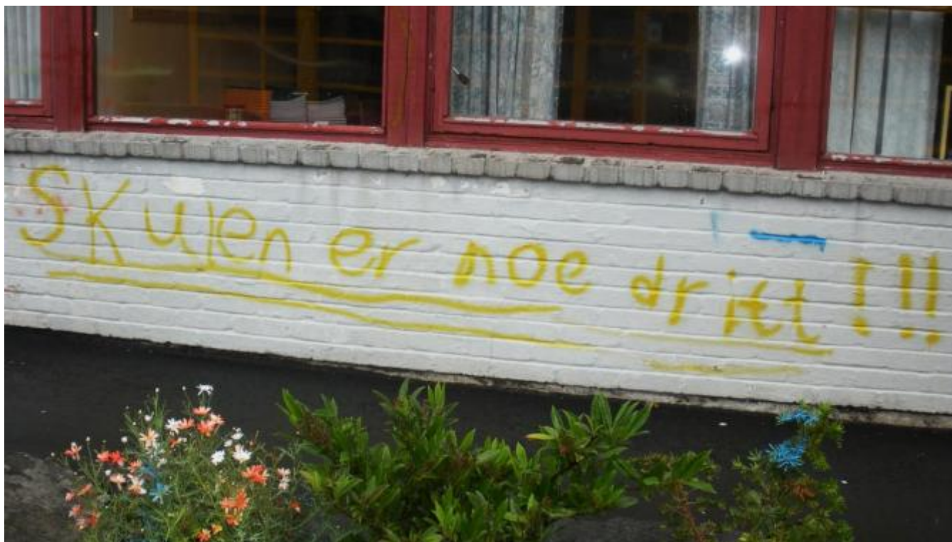
Klar melding på skuleveggen.

Vandalar har tagga ned og grisa til skulen i Uskedaleni helga!