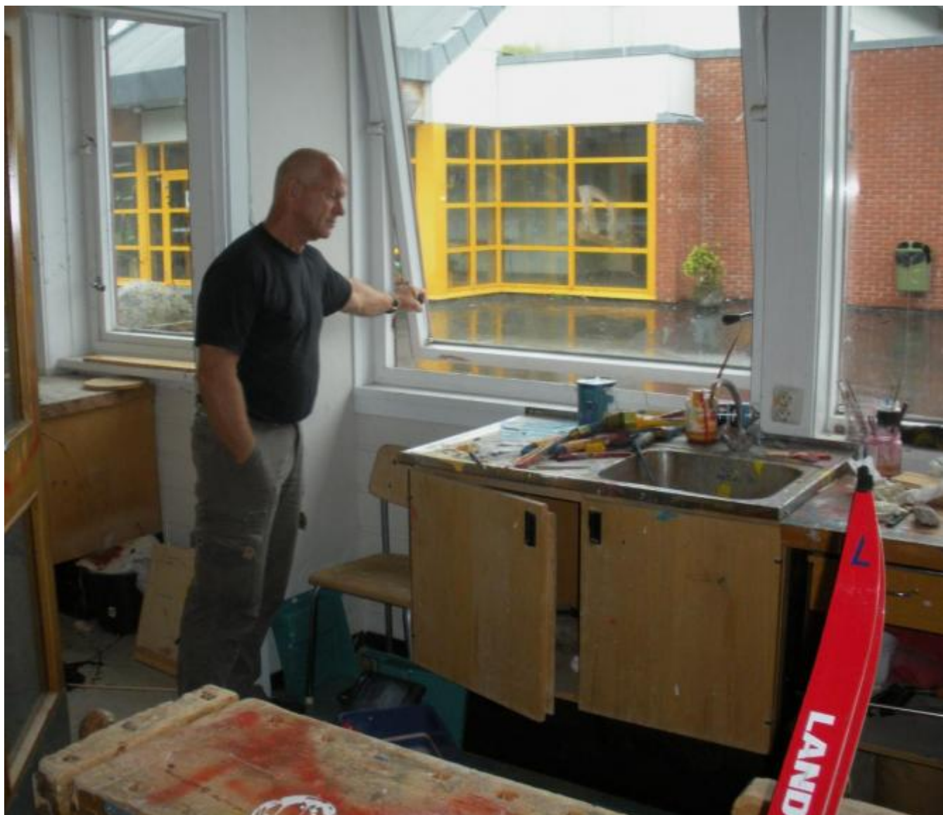
Her har vandalane truleg kome seg inn

Deler av skulen, både inne og ute, er eit rystande syn etter det som har gått føre seg - særleg med hjelp av måling og spray. Haugland trur at ei elevgruppe på mellom 10 og 13 år må stå bak "verket".