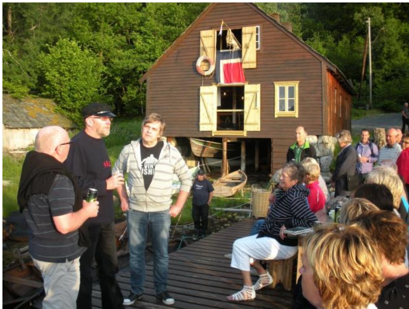
Klart for ny Bøkkerkveld: Vertskapet og kvartett-leiaren står til venstre

Transport - i vidaste forstand - og mjuke jazztonar prega den tradisjonelle Bøkkerkvelden.