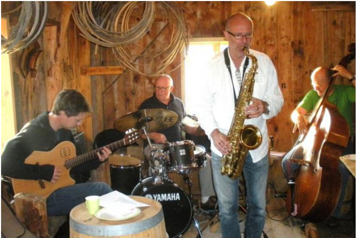
Kvartetten spelar jazz i særprega miljø