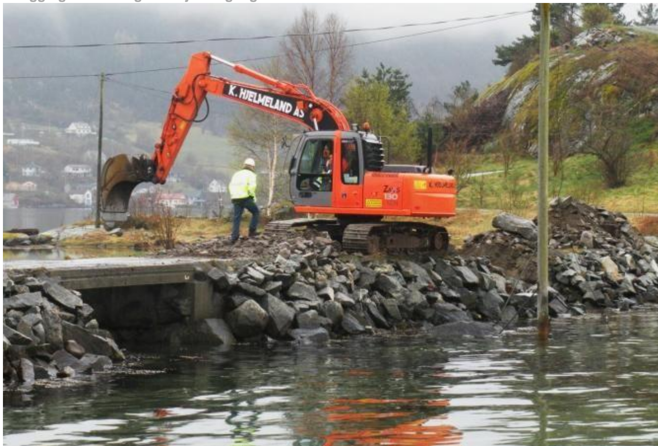
Det blir no grave ein eigen kanal for passeringa av sundet.

Ein ny fase i kloakkprosjektet i Uskedalen er no i gang.