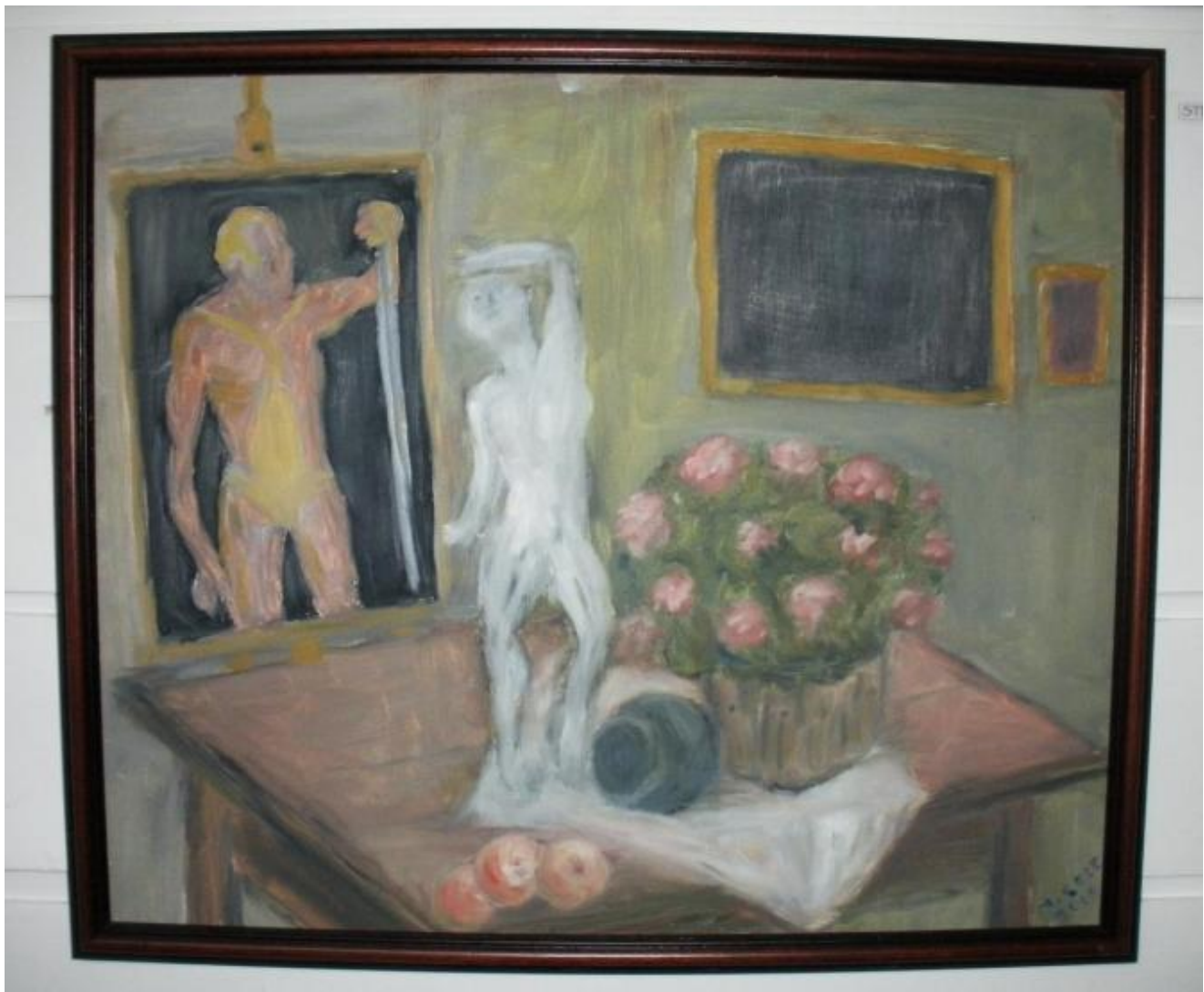
Stilleben måla av Magnus Sæle.

Han presenterar to måleri i biblioteket - det eine er eit stilleben og det andre eit landskap - med ei gammalt hus frå Sunnfjord i fokus.