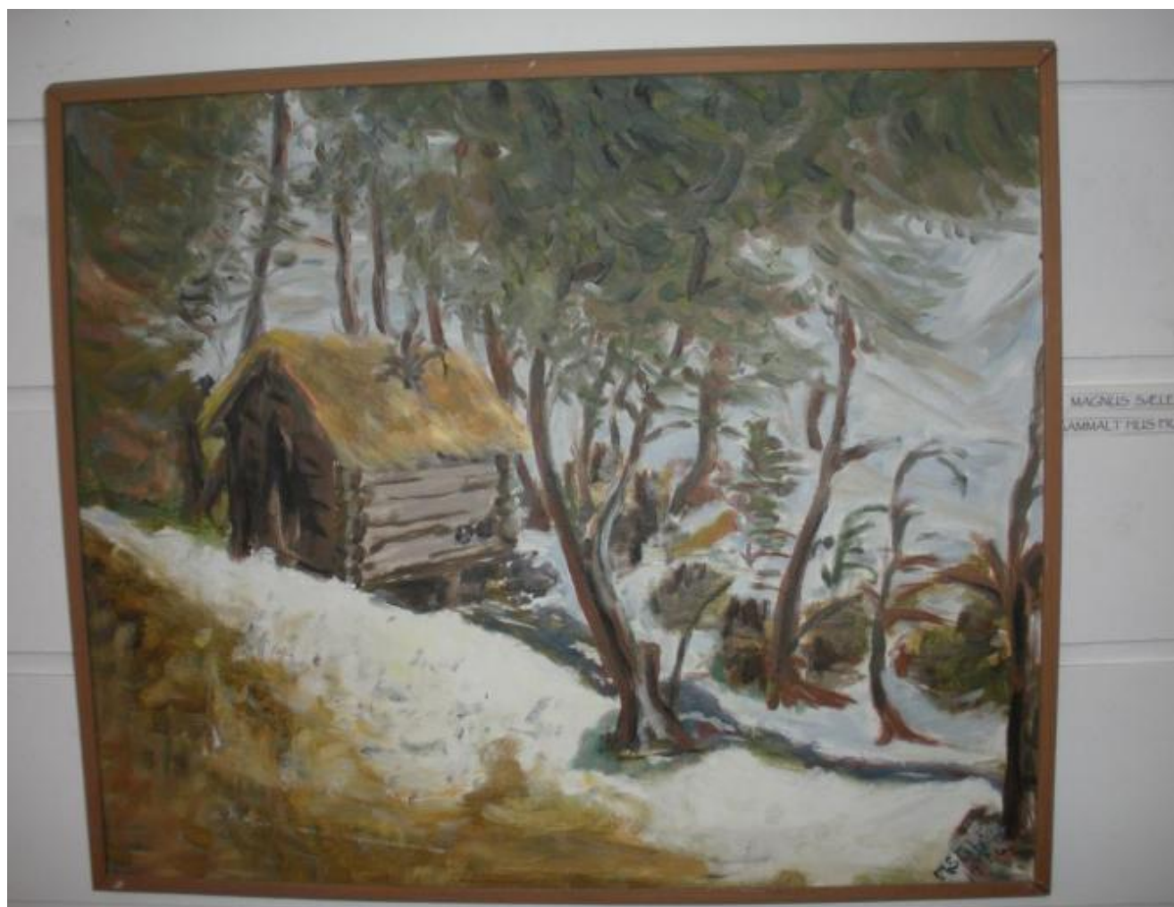
Gamalt hus i Sunnfjord måla av Magnus Sæle. (Foto: Ola Matti Mathisen)

I kveld opna kulturfestivalen på Husnes med den storslagne utstillinga som har samla 39 utstillarar og 77 bidrag..