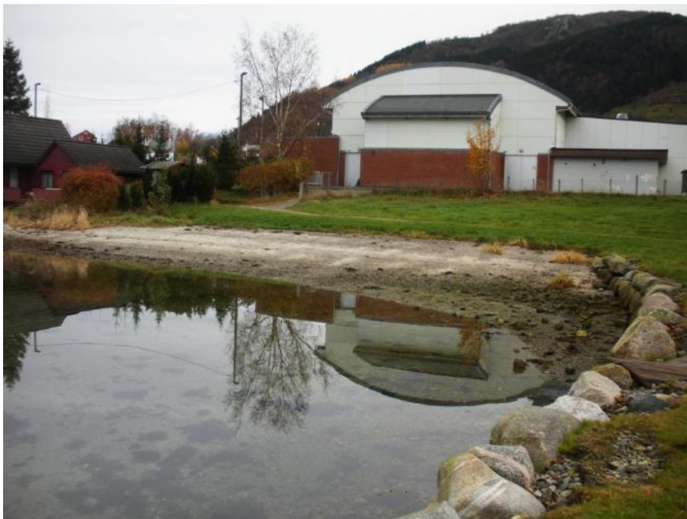
Pumpestasjonen er planlagt plassert mellom Aktivitetshuset og badestranda.