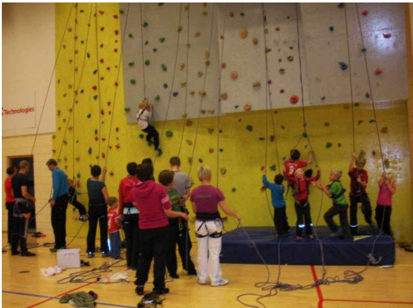
Blir det kø ved klatreveggen framover?

.40.000 er satsa på prosjektet. Sjøelve veggen har kosta 25.000, som blir dekket av Aktivitetshusets Damevenner. I tillegg er det kjøpt inn utstyr for 15.000 som skal betalast gjennom drifta. Veggen kjem frå Seimsfoss, men er kraftig utvida og komplettert.