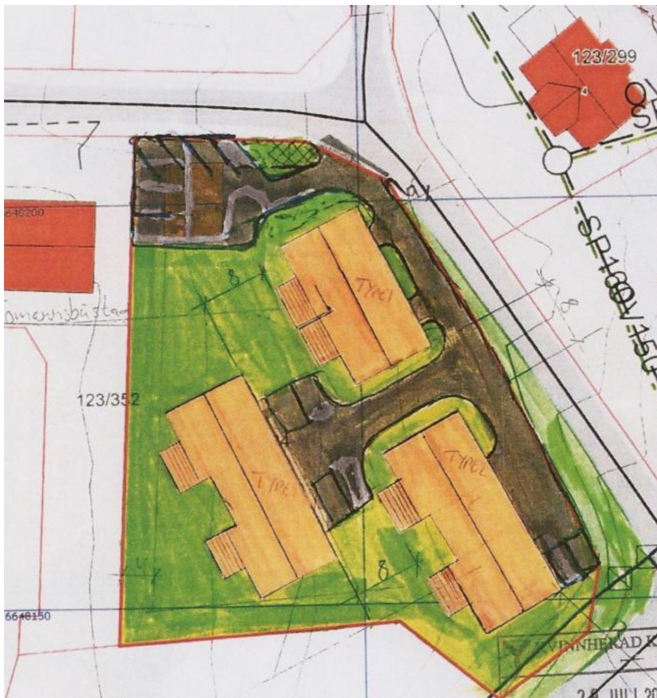
Denne skissa viser kor tomannsbustadene skal liggja.

Dette inneber at Harsvik sitt prosjekt på området er "rigga ned" ein god del. På den ledige grunnmuren i det tidlegare Hagesenteret vil det no bli bygd fire bustader på eitt plan og ikkje åtte i to plan og bruttoareal blir 73 kvadratmeter. I dei tre husa som blir lagt oppe i bakken mot Geilo blir det bygd seks vertikaldelte tomannsbustader på eitt plan istaden for einebustader på tre plan. Maksimal mønehøgde blir her fem meter og bruttoareal 86 kvadratmeter. Med andre ord blir alle dei nye husa låge og til liten sjenanse for naboane.