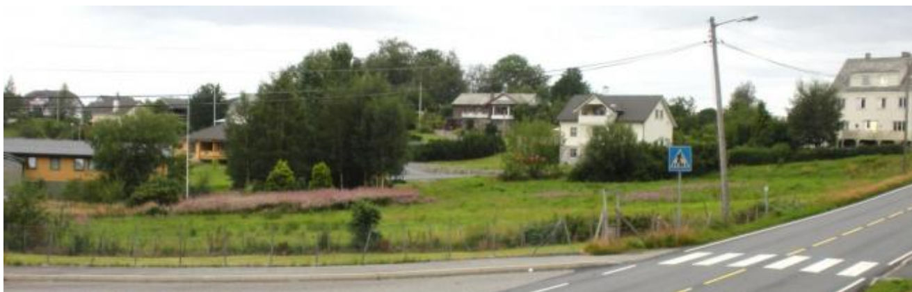
Dei tre tomannsbustadene skal liggja opp mot Geilo.