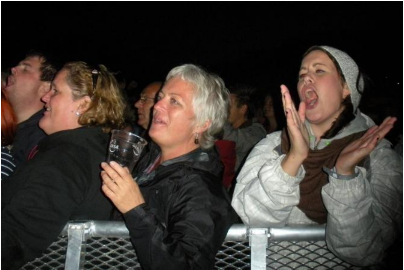
Det er Åge-fans i alle aldrar.

Det vart ein gong skrive om Alf Prøysen at hans produksjon hadde vorte folke-eige. Men no kan det samme seiast om Åge Aleksandersen. Mange Åge-låtar er slike som folk flest kan og som dei nynnar på fordi dei sit lagra inst i sjela.