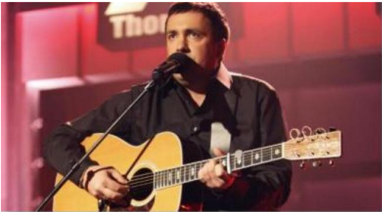
Får strålende kritikkar for si første plate.

Festivalen har glede av å invitere til kick off-fest på Vertshuset i Uskedalen, fredag 24. juli kl 20.00 til 01.00, opplyser Festivalensjef Sveinung M. Pile.