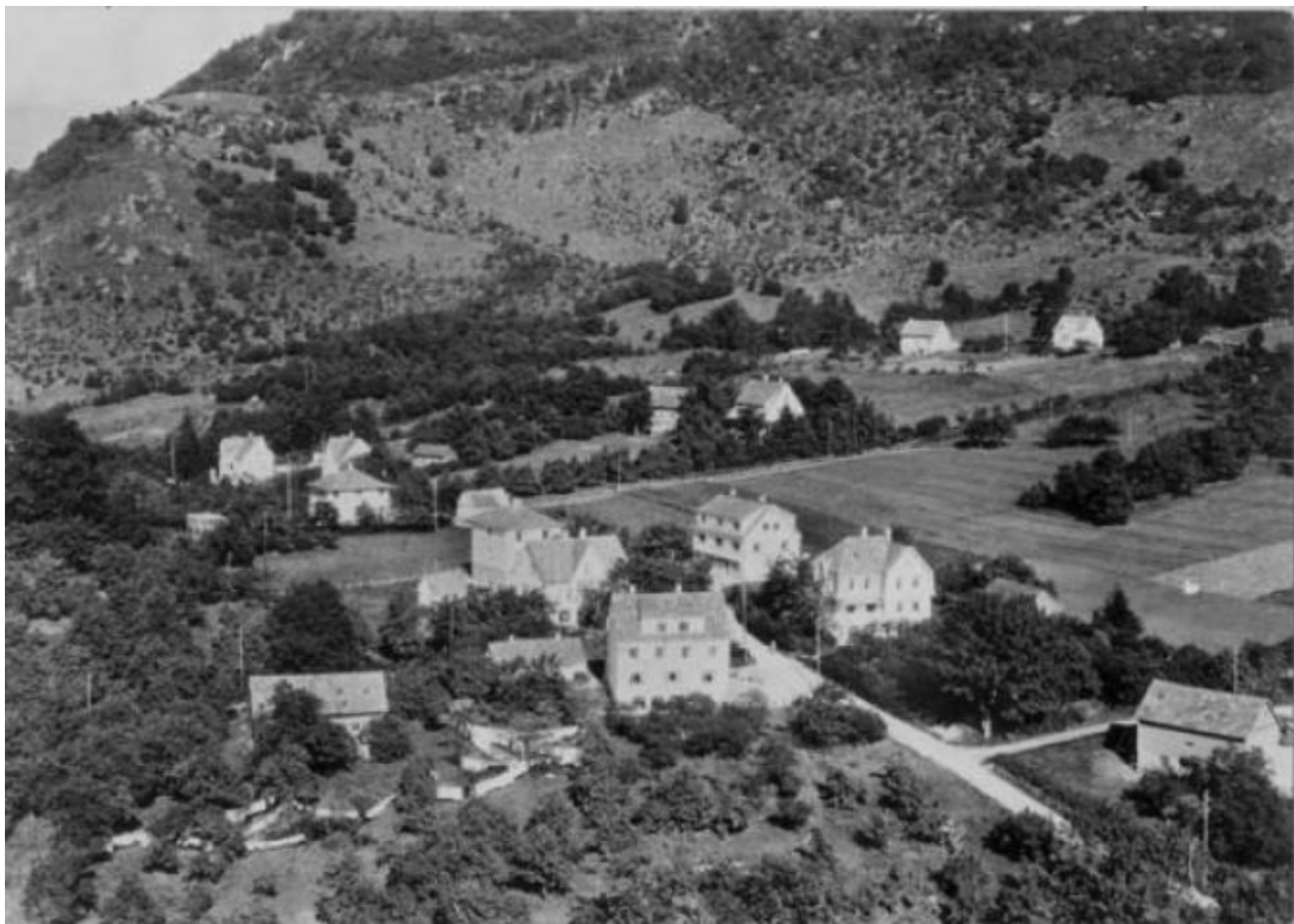
Frå Brekketoppen mot Halsane i 1954.

Dette kan bli eit spanende gjensyn med bygda slik ho var i perioden 1950/1970. Men invitasjonen gjeld også foto som er teke seinere hvis dei syner ei bygningshistorisk utvikling.