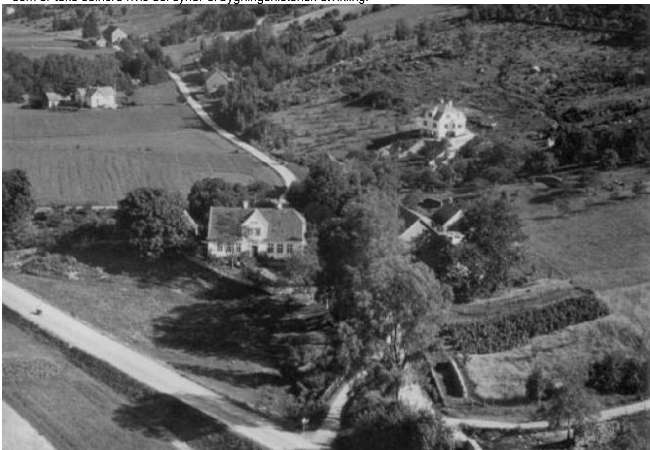
Kapteinsgården - truleg på 1950-talet

Dette kan bli eit spanende gjensyn med bygda slik ho var i perioden 1950/1970. Men invitasjonen gjeld også foto som er teke seinere hvis dei syner ei bygningshistorisk utvikling.