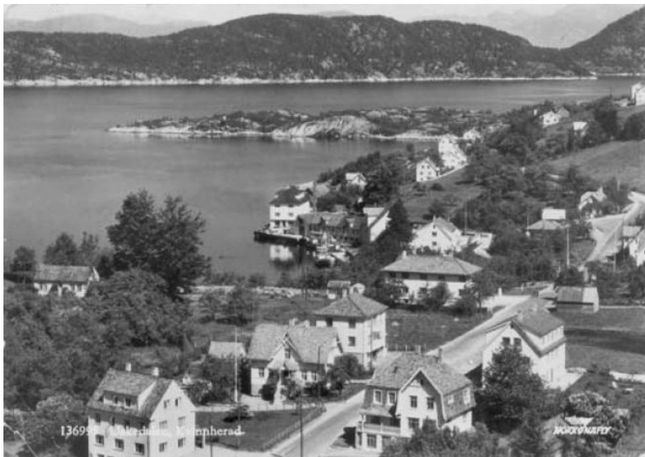
Norrønafly tok dette biletet i 1960 frå Brekketoppen mot Beinavikjø.