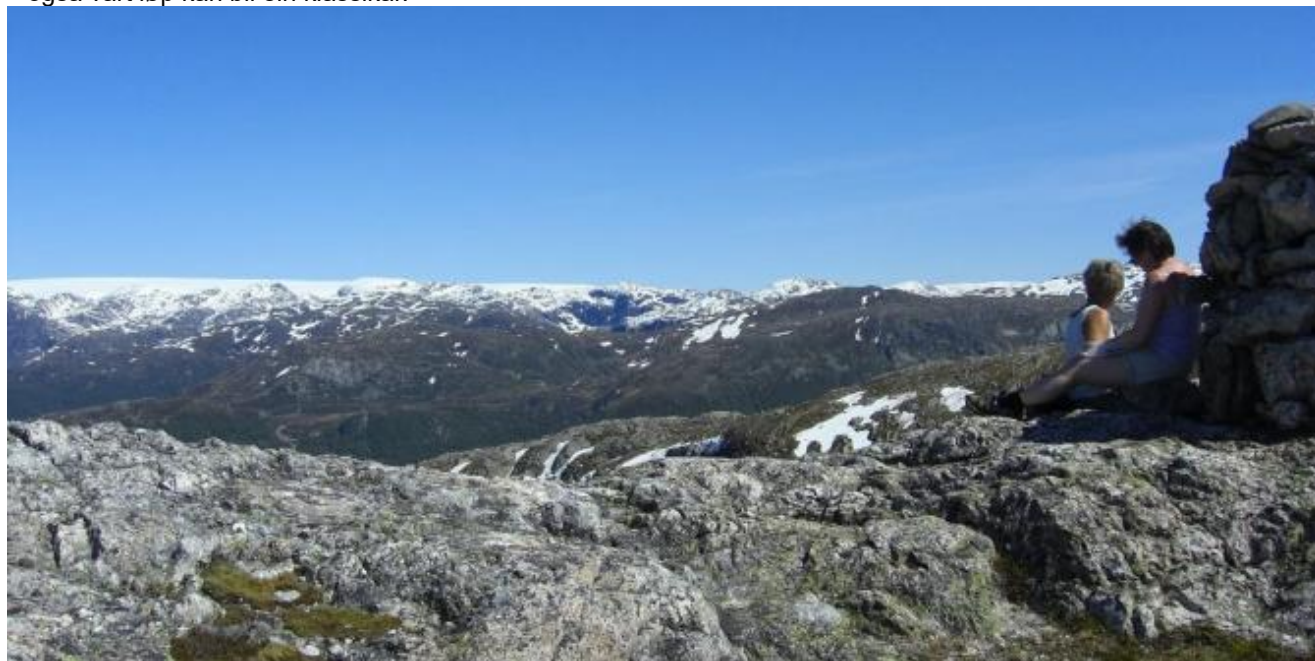
Frå toppen av Solfjell er det eit fantastisk panorama - her mot Folgefonna.