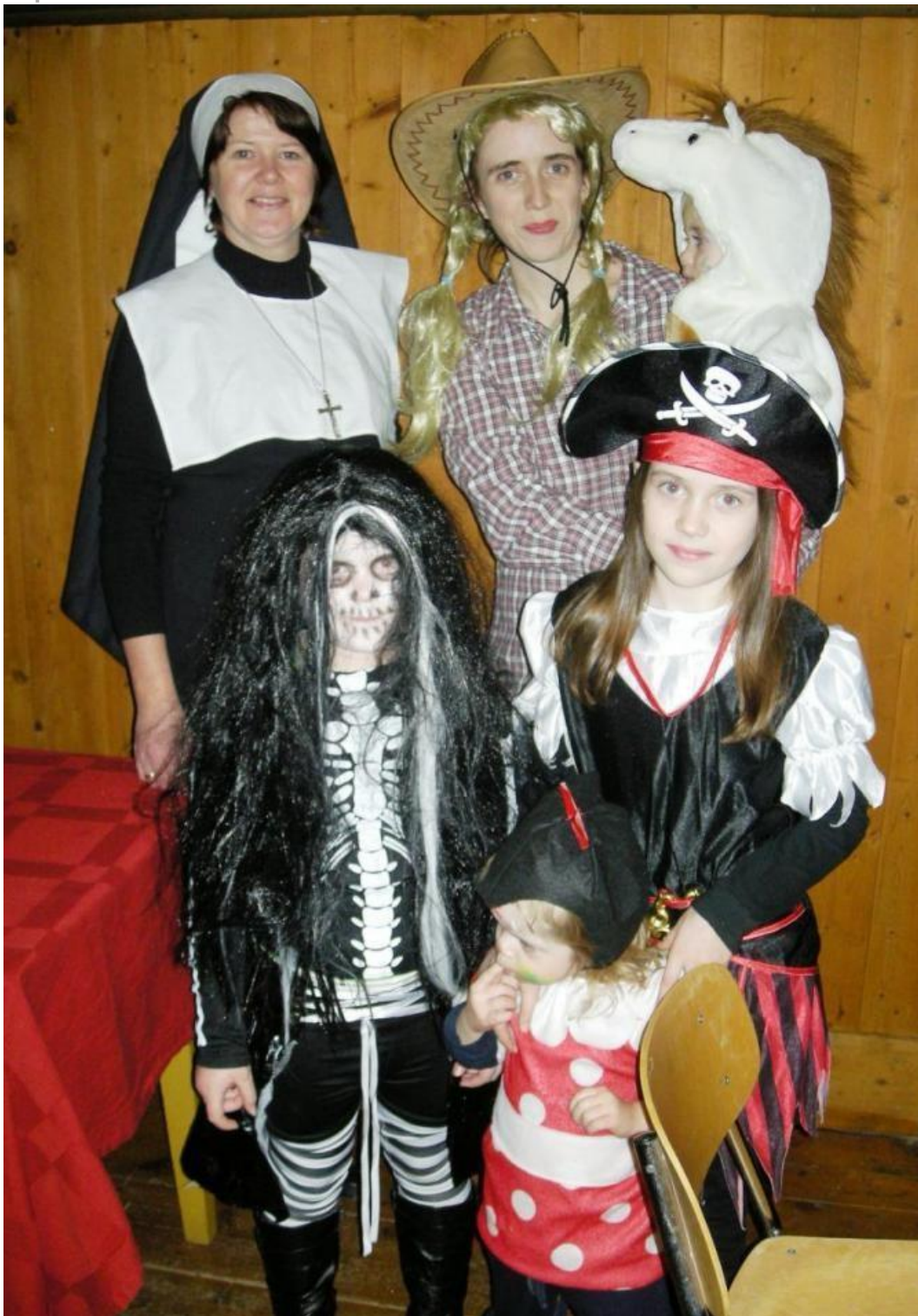
Ikkje minst vertskapet hadde lagt stor fantasi for dagen.

Karnevalet i Rio starta for ei veke sidan og vart avslutta tysdag. Såleis var karnevalet på Vonheim laurdag ettermiddag litt bakpå med omsyn til tidspunktet . Til gjengjeld hadde uskedalingane lagt stor fantasi for dagen med kostymeringa!