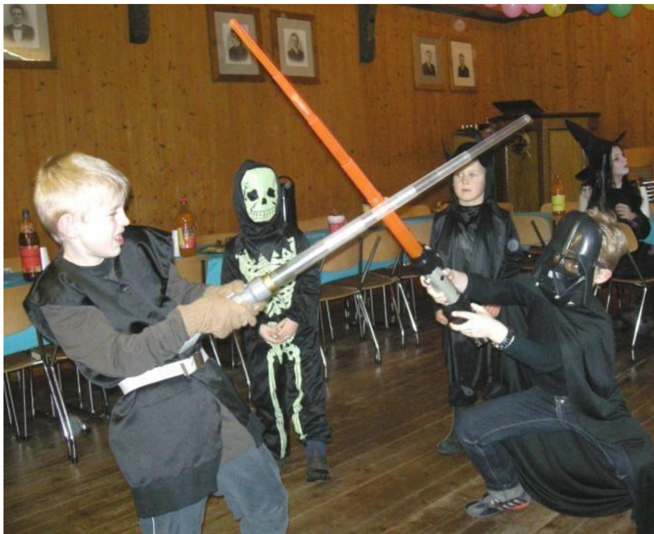
Det gjekk friskt for seg på Vonheim.

Ikkje berre fekk dei leika seg og ta seg ut for andre, dei opplevde også rikeleg servering og ei overrasking som hang oppunder taket.