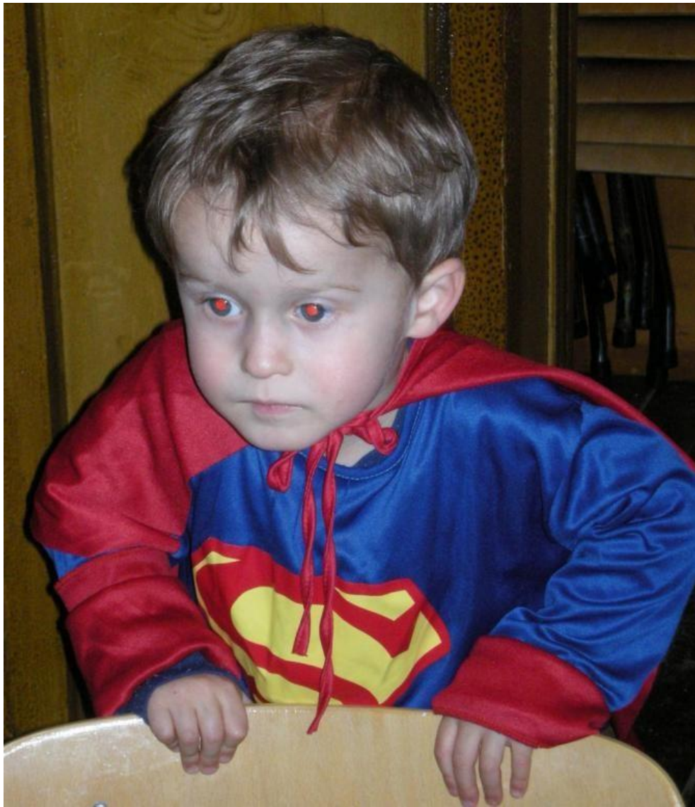
Vi møtte minst ein supermann.

Karnevalet hadde eit dobbelt siktemål: Ein femtilapp for kvar av dei unge sikra rundt rekna ein tusenlapp til Vonheim. Og dei unge hadde to svært kjekke timar saman og med foreldra.