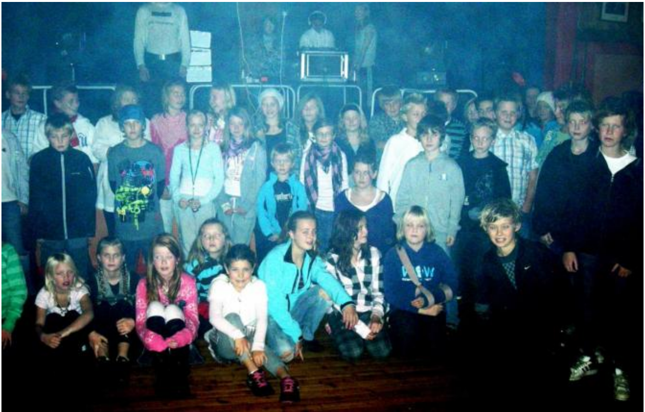
Så mange var det på diskotek i Helgheim 17. oktober i fjor.