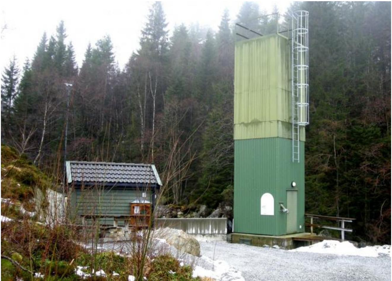
Kalkdoseraren har hatt avgjerande verknad for å sikra det biologiske mangfaldet i børsdalselva og Uskedalselva.