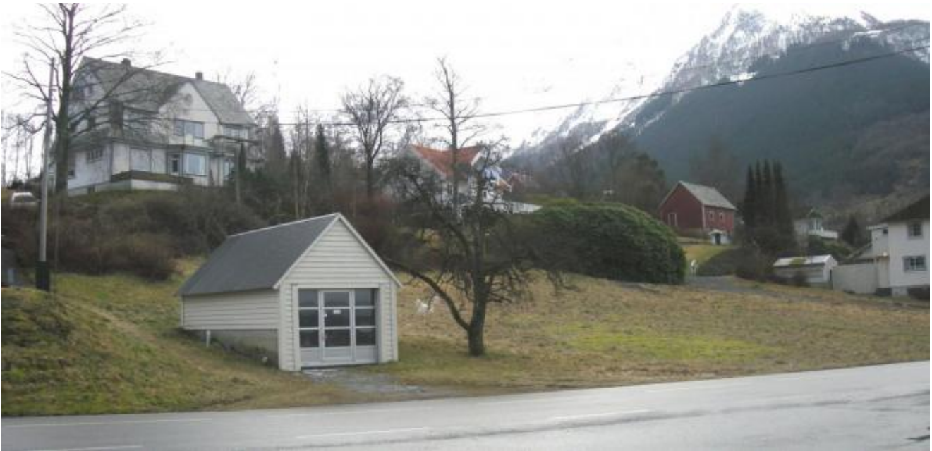
Det er området til høgre for garasjen som er tenkt nytta til eldrebustader. Riksvegen i forgrunnen.

Rådmannen er positiv til å gje dispensasjon slik at eit sentralt område i Uskedalen kan nyttast til byggjing av ein tremannsbustad. Men litt meir dokumentasjon må på plass før kommunen kan ta endeleg stilling i saka.