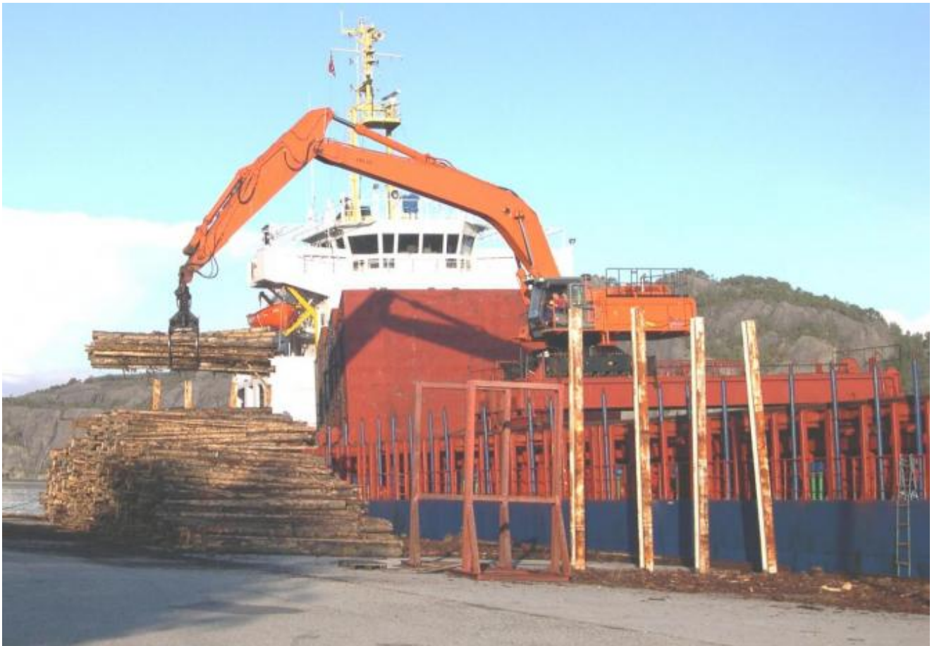
Tømmerlastning på Børnes i oktober i fjor. Men det er ikkje 'Mirabelle' som lastar i dette tilfellet, opplyser Vestskog.

4000-tonnaren 'Mirabelle' som havarerte ved Ænes i morgontimane i dag (fredag) var undervegs til Børnes i Uskedalen for å lasta tømmer, får uskedalen.no opplyst hos Vestskog i Granvin. Båten hadde lasta tømmer i Granvin. Styrermannen, som er frå Ukraina, har innrømme i politivhøyr at han sovna på jobb og vakna då båten støyte mot land.