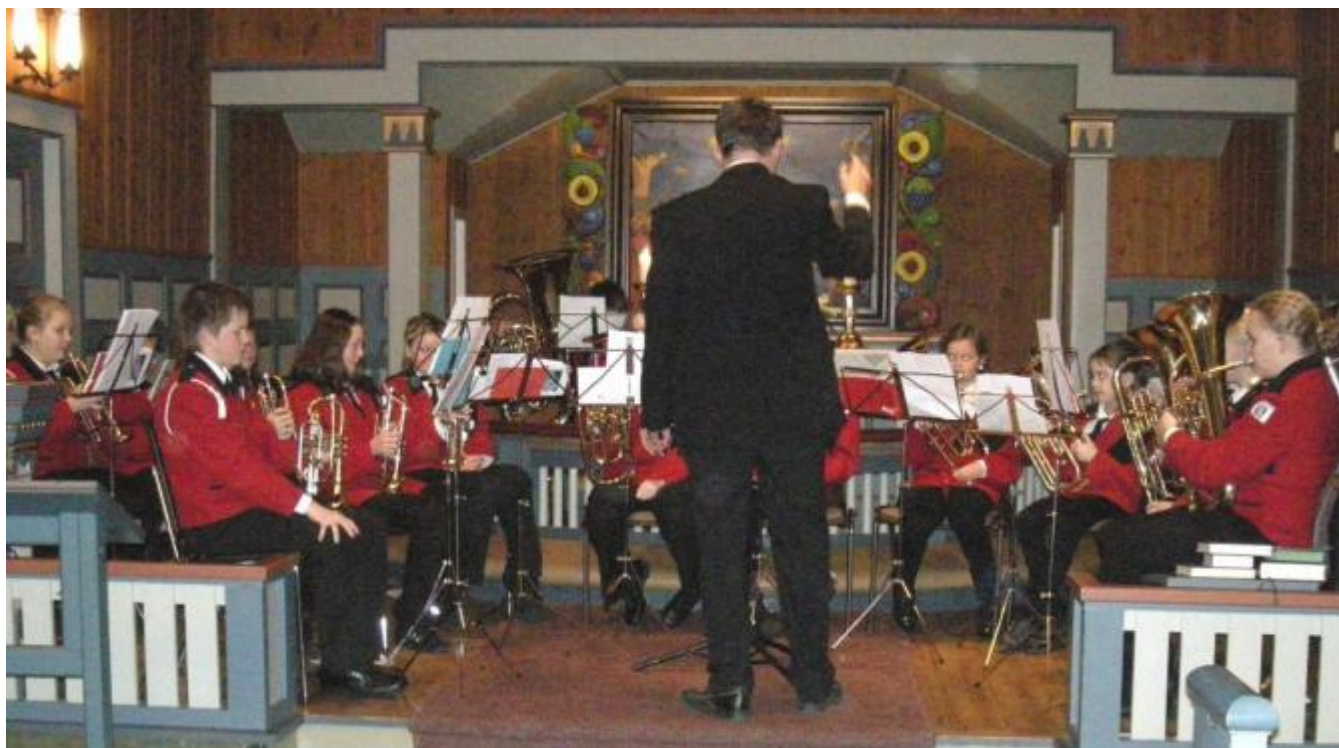
Skulemusikken blir flinkare for kvar konsert.