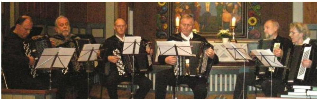
Kvinnherad Trekkspelklubb spela Sibelius og Telemann.