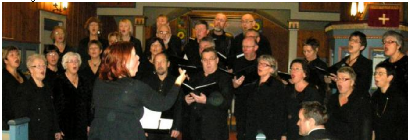
Røysterett for alle gav smakebitar frå "Mariamusikken"

Sjølv om han var noko indisponert, nådde han med si mektige røyst nesten opp på Kørberg-nivå då han avslutta med "O helga natt". Og då han song "Gører portarne høga" var det som om ein liten storm løfta kyrkja. Røen er også komponist og tekstforfattar og presenterte to eigne produkt. Ein av allsongane var "Mary's Boychild" med hans eigen tekst og ein av solosongane var "Gjeterguten sin song" der han har ansvaret både for tekst og melodi.