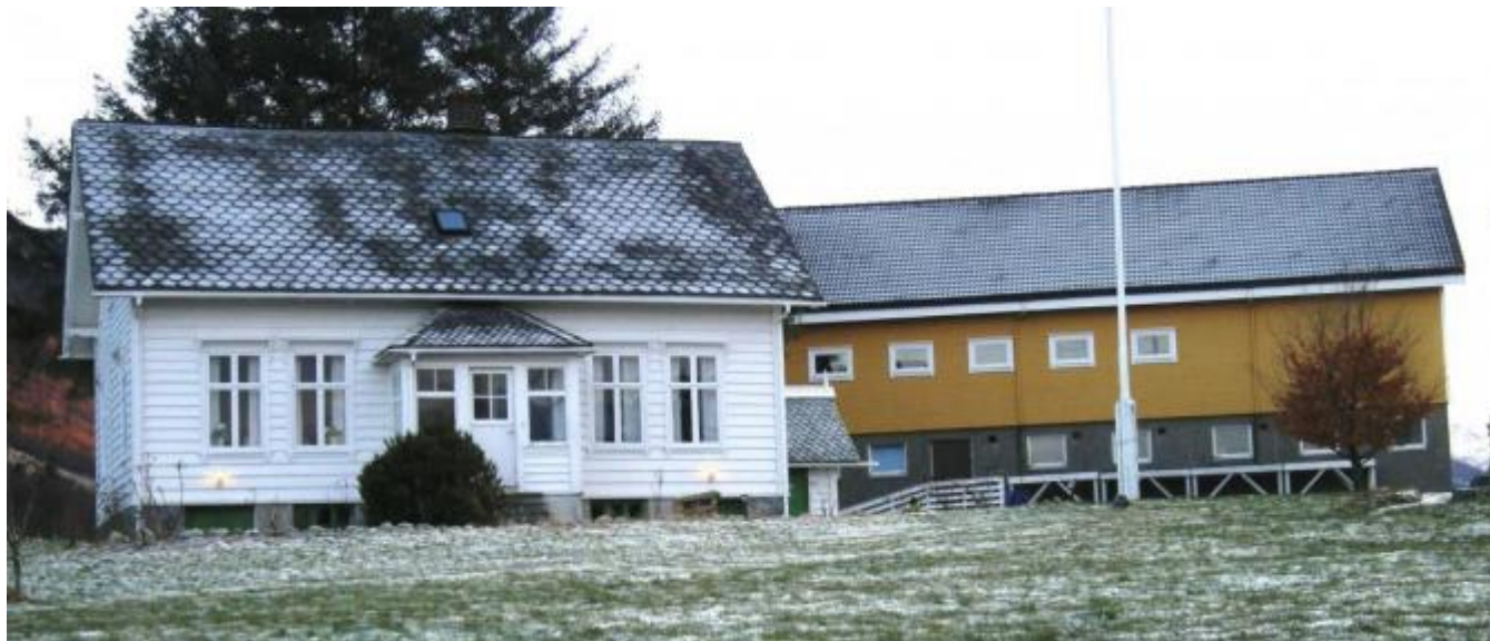
Rømningsvegane frå Dønhaugkjedlaren (til venstre) og låven kjem på politikarane sitt bord til veke.