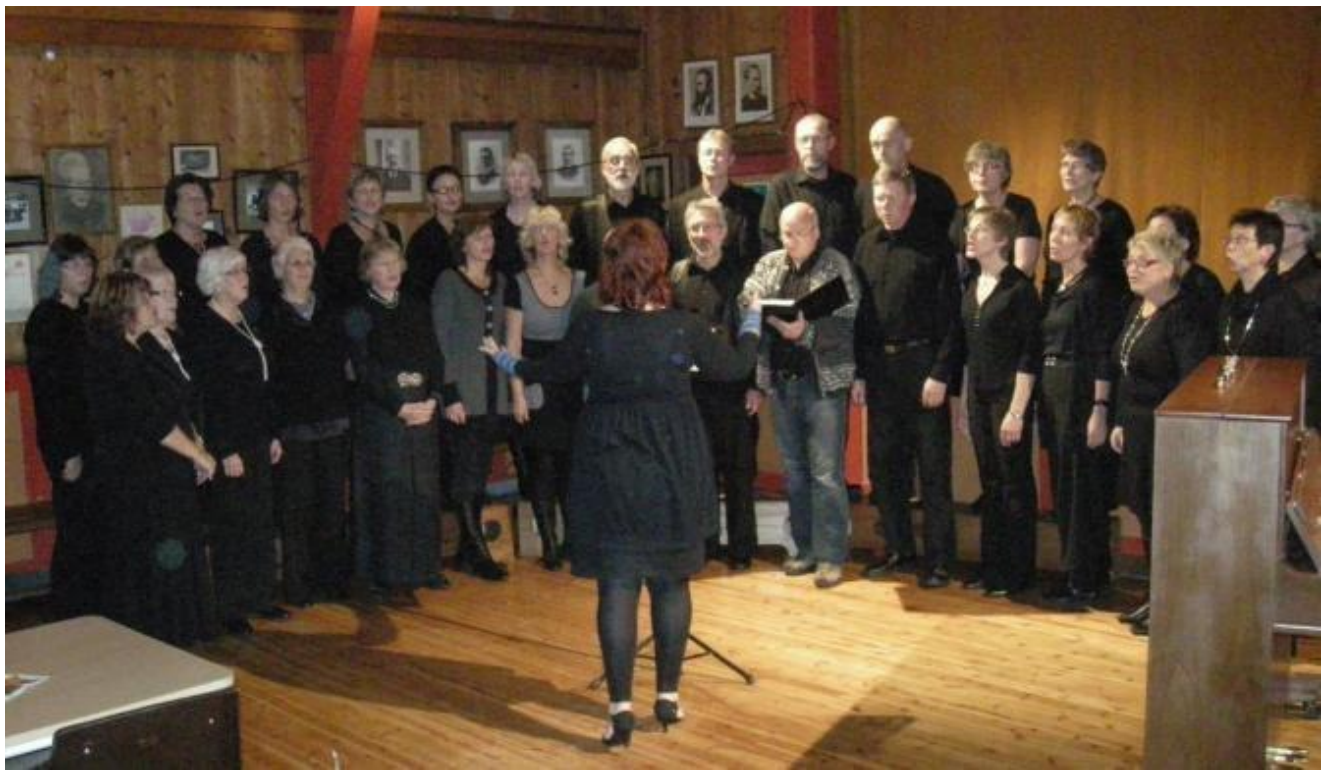
"Røyserett for alle" syng i Helgheim torsdag.