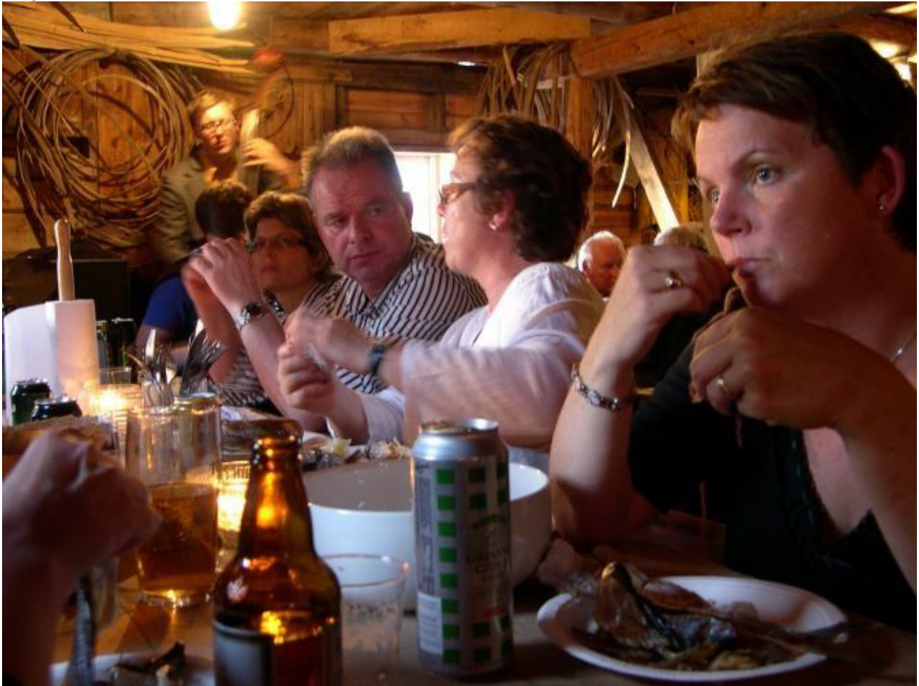
Lubbesilda fekk også mykje skryt. Her er vi midt i måltidet.

Dei 70 som kom – og fleire var det ikkje plass til – hadde nokre fine timar saman i eit særreige sjøbruksmiljø. Også denne bøkkekvalden vart ein suksess - med deltakarane som ein del av ei levande kulturhistorie.