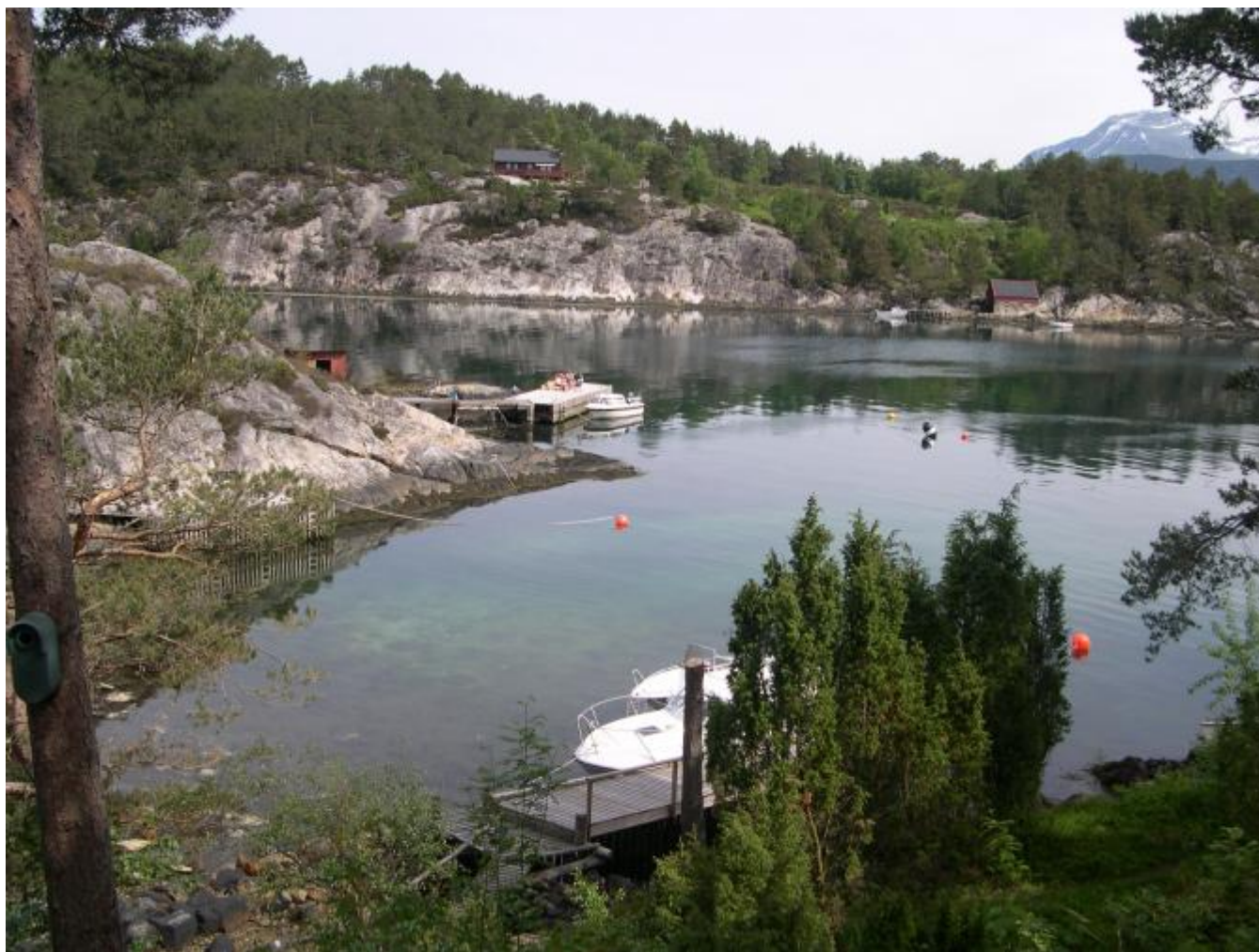
Dette bildet er teke frå hytta som nyleg er seld mot området på den andre sida av søre Skorpevågen der det skal byggjast tre nye hytter.

Meklarer i Sparebanken Vest seier til uskedalen.no at salssummen var høgare enn forventa sjølv om det ikkje har vore nokon spesiell prisnedgang på hytter ved sjøen i dette distriktet i det siste.. Summen strekar under at Skorpo får stadig høgare status som hytte-eldorado. Det kom bod frå folk både i lokalmiljøet og utanfrå og det var ein utanfrå som til slutt fekk tilslaget etter ein frisk "innsput" med bod.