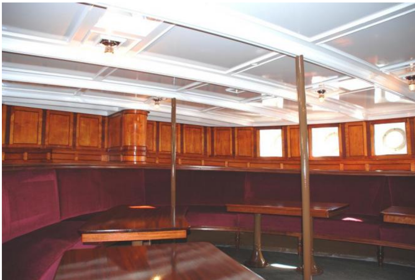
Detalj frå 1. plass salong.

Innredningsarbeida er ikkje ferdige, mellom anna gjenstår 2. plass salong, postkontoret, billettkontoret, lugarar og mannskapsmessa. I tillegg må toaletta oppgraderast med septiktank. Men etter at båten kom frå fartøyvernssenteret i Norheimsund i mai og rednings- og sikkerheitsutstyret no er på plass, vil Stiftelsen søkja Sjøfartsdirektoratet om eit mellombels passasjersertifikat for 98 passasjerar, opplyser Sætre. Interesssa for båten er stor og mange vil leiga han, Allereie på laurdag 7. juni vil han vera med på Torgdagen i Bergen. I tillegg er det kome forespurnad frå Kvam, Tysnes, Stord og Stavanger om bruk av båten under ulike arrangement, men kor mange av desse båten kan delta på er mellom anna avhengig av passasjersertifikatet og bemanning.