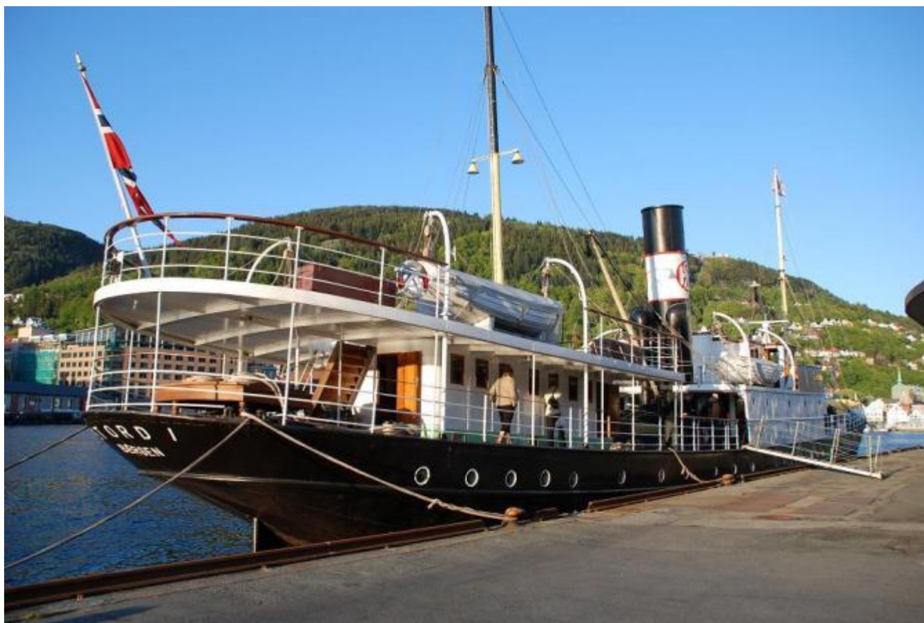
Stord I ligg no ved Holbergskaien i Bergen.

DS ”Stord I” vil bli å sjå i fjordane denne sommaren, men det gjenstår å sjå kor mange turar det vert, seier veteranbåtentusiasten frå Uskedalen, Harald Sætre, til uskedalen.no. No ligg det stolte skipet, som brann men som fekk nytt liv, ved Holbergskaien i Bergen.