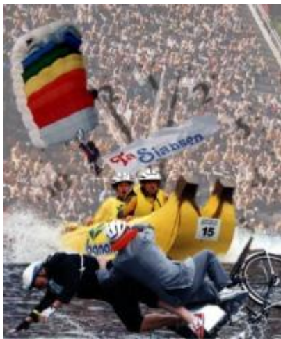
Full fart i Holmenkollen i 2001