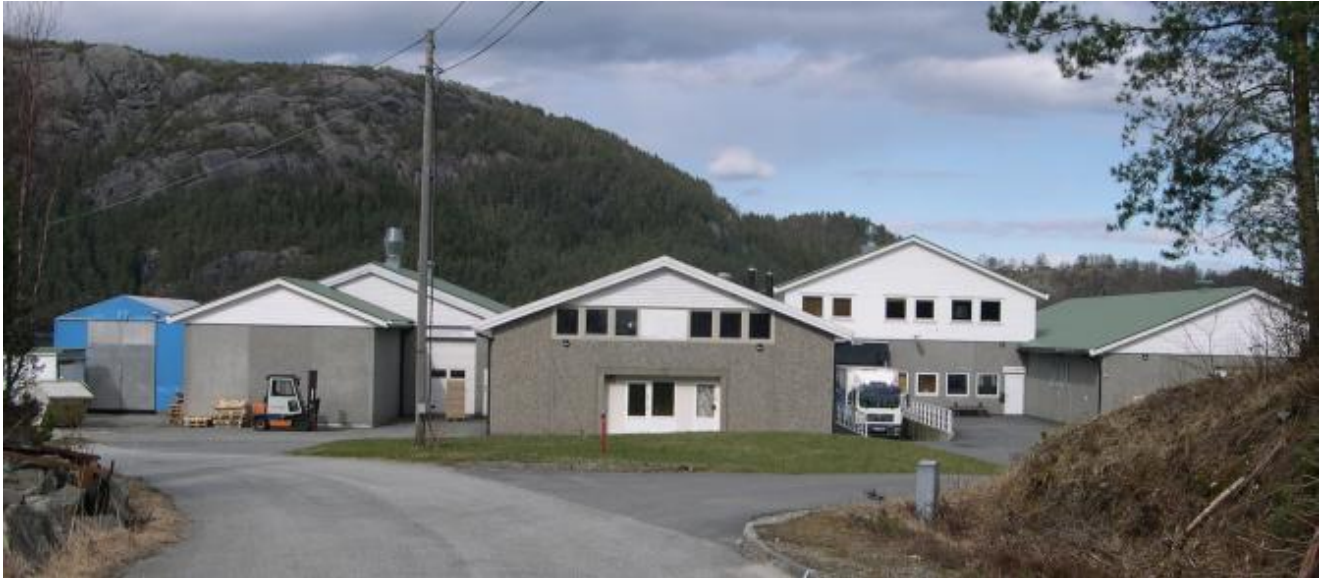
Hjønnevåg har halde til i Børnes Industriområde sidan tidleg på 1980-talet.