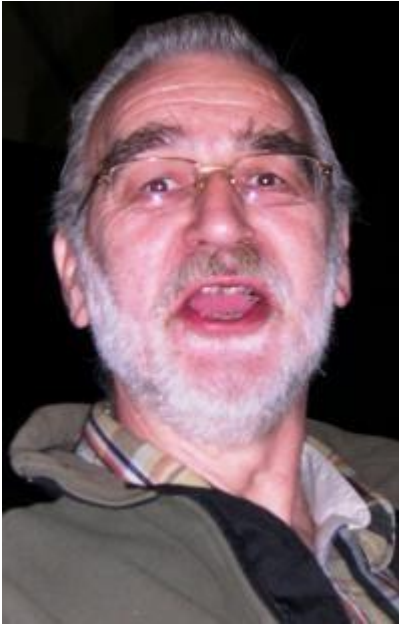
"...det lider alt frem"