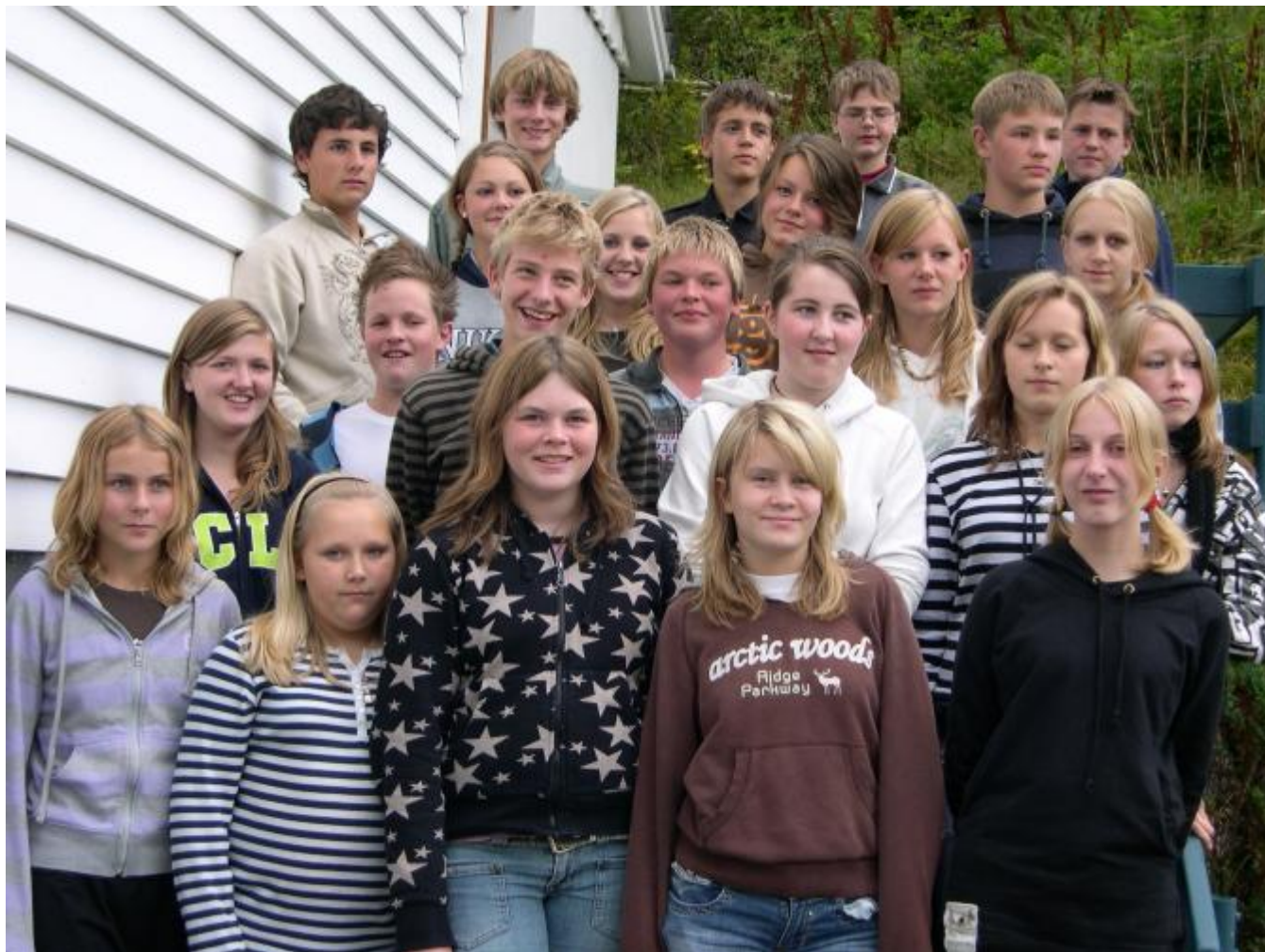
Dette er konfirmantkullet i år i Uskedalen. Tysdag ettermiddag skal dei samla inn til Kirkens Nødhjelp.