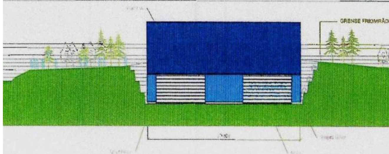
Sett forfra (Mot aust)

Dette er ei ideskisse som viser bygget (i blått) som sanden skal mellomlagrast i før den vert lasta på båt.