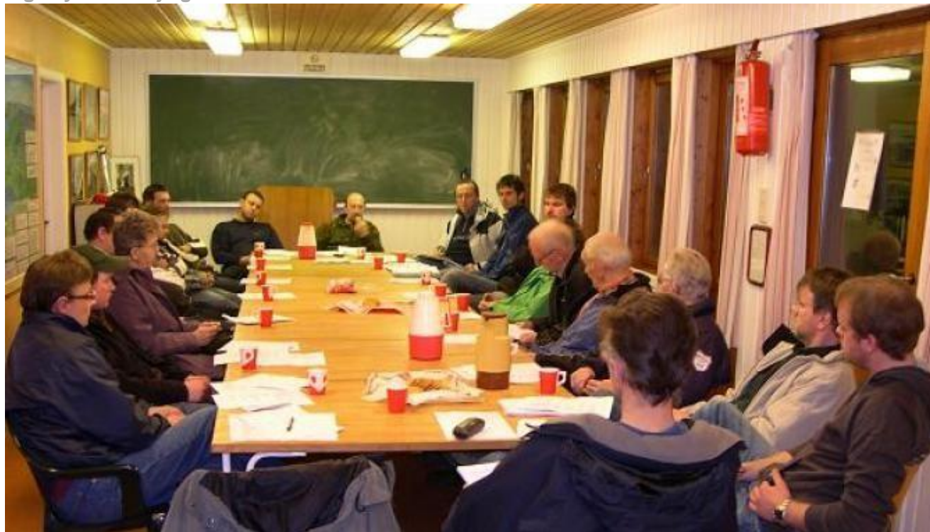
Oppslutnaden om årsmøtet var uvanleg stor denne gongen – på grunn av saka om verdisetjinga.

Det blir ikkje noko ny verdisetjing av fiskeressursen i Uskedalselva førebels. Det var konklusjonen då saka var oppe under årsmøtet på Stemneplassen fredag. Styret skal arbeida vidare og koma med eit forslag om endring – eller ikkje endring.