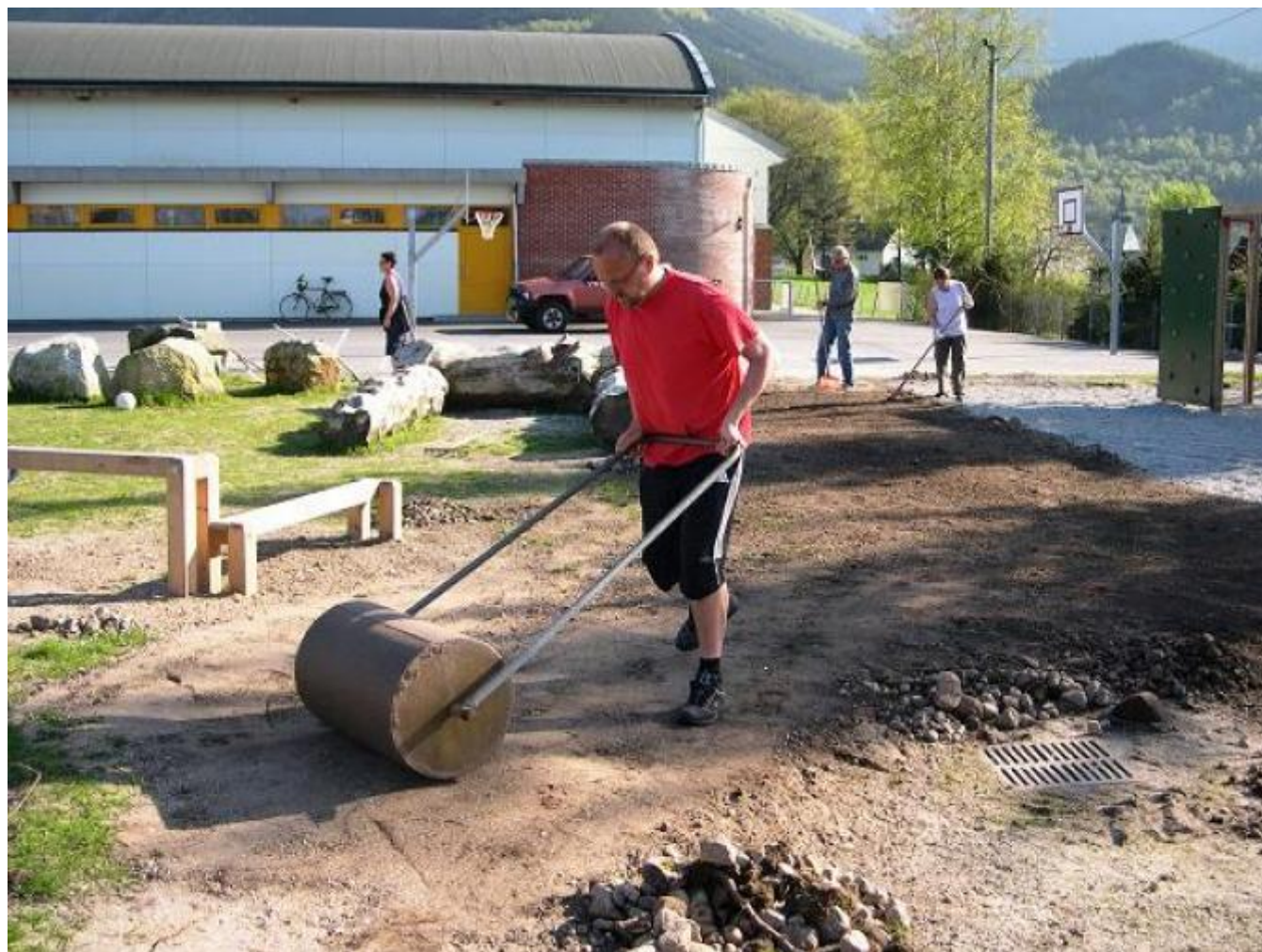
Også lærarane var flinke til å delta i opparbeidinga av uteområdet og bortimot alle verkar nøgde med resultatet.