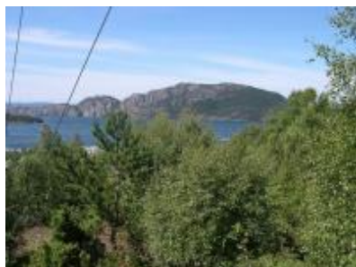
Slik var utsynet frå Skårhaug sommaren 2006.

Han viser til at vegetasjonen har teke heilt overhand slik at det ikkje lenger er mogeleg å nyta utsikten frå toppen mot dei sentrale delane av Uskedalen, i hvert fall ikkje om sommaren.