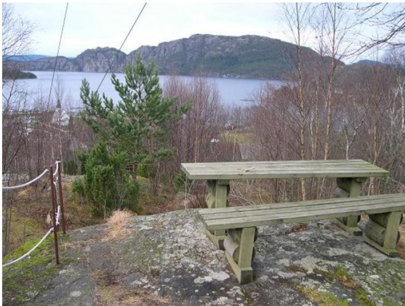
Slik er utsynet i desember 2007 (Foto: Ola Matti Mathisen).

Kven vil og kan ta på seg jobben med å rydda opp i Skårhaug, spør ein oppsittar i området som er i tvil om eigedomstilhøva der.