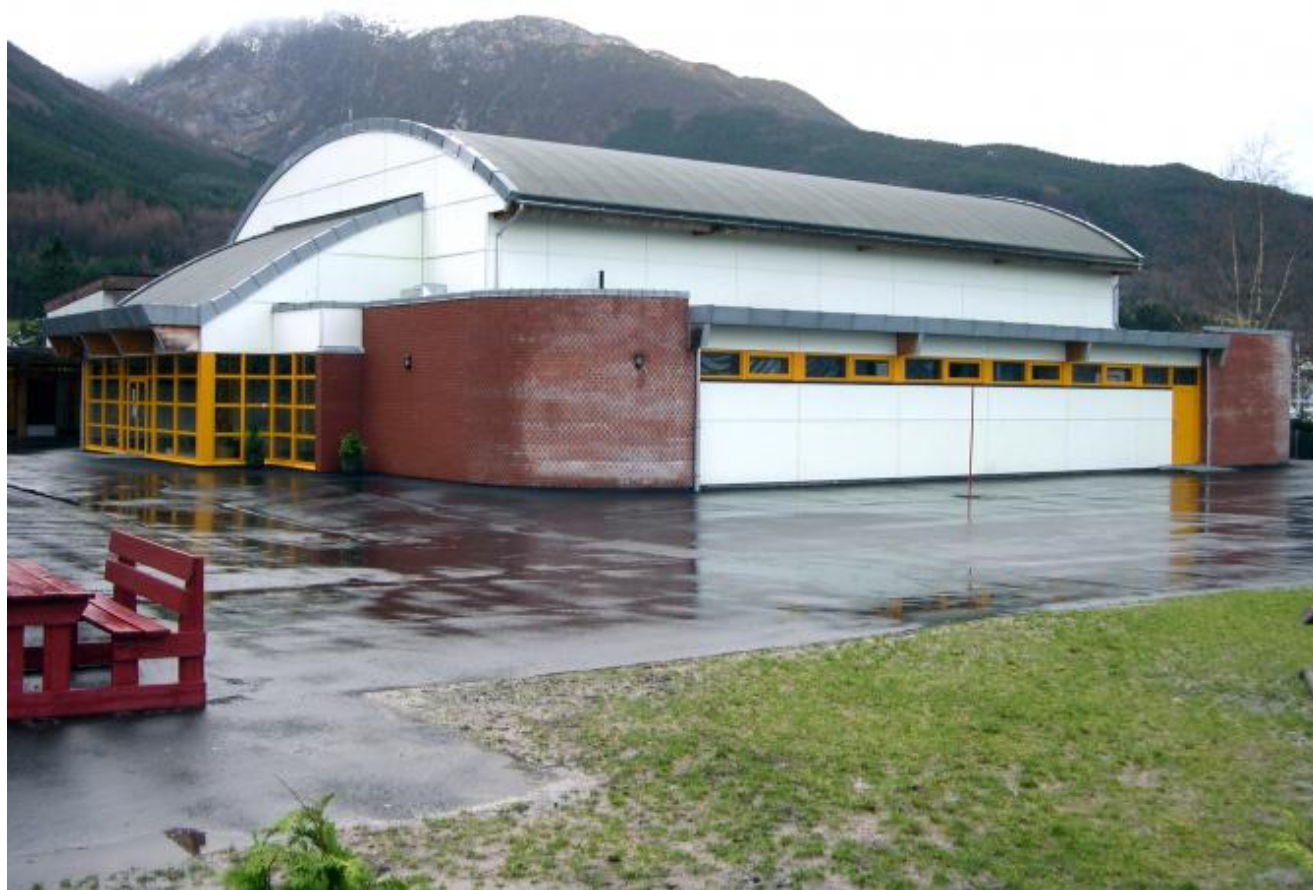
Garderobane i Aktivitetshuset vil venteleg bli påbegynt om en liten månad.