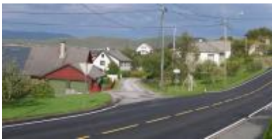
- og slik er krysset i dag.

Kva meiner du om framlegget til reguleringsplan for Beinavikjo-området? Det kan du gje uttrykk for hvis du kjem på det opne møtet som Uskedalen Utvikling held tirsdag kveld i gamleskolen (klokka 19).