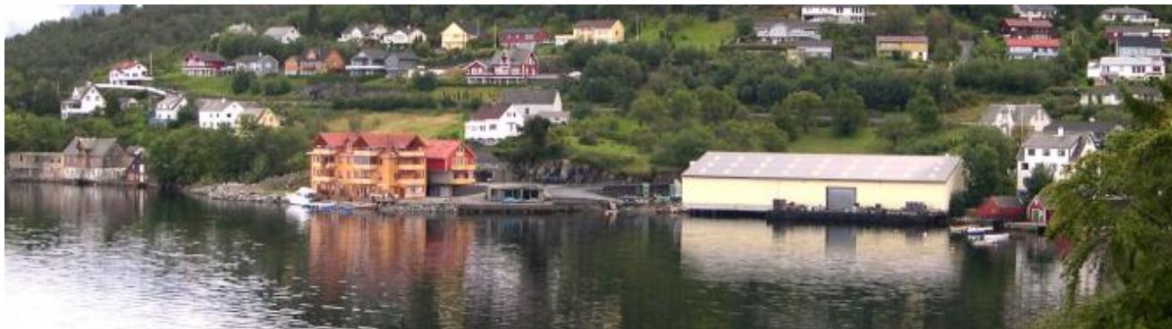
Dette er det aktuelle område i Beinavikjø som no blir regulert for fleksibel utnytting.