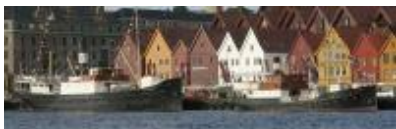
Stord I og Granvin foran Bryggen i Bergen

Men det også planar om å gå einskilde turar til Sunnhordland og Hardanger.