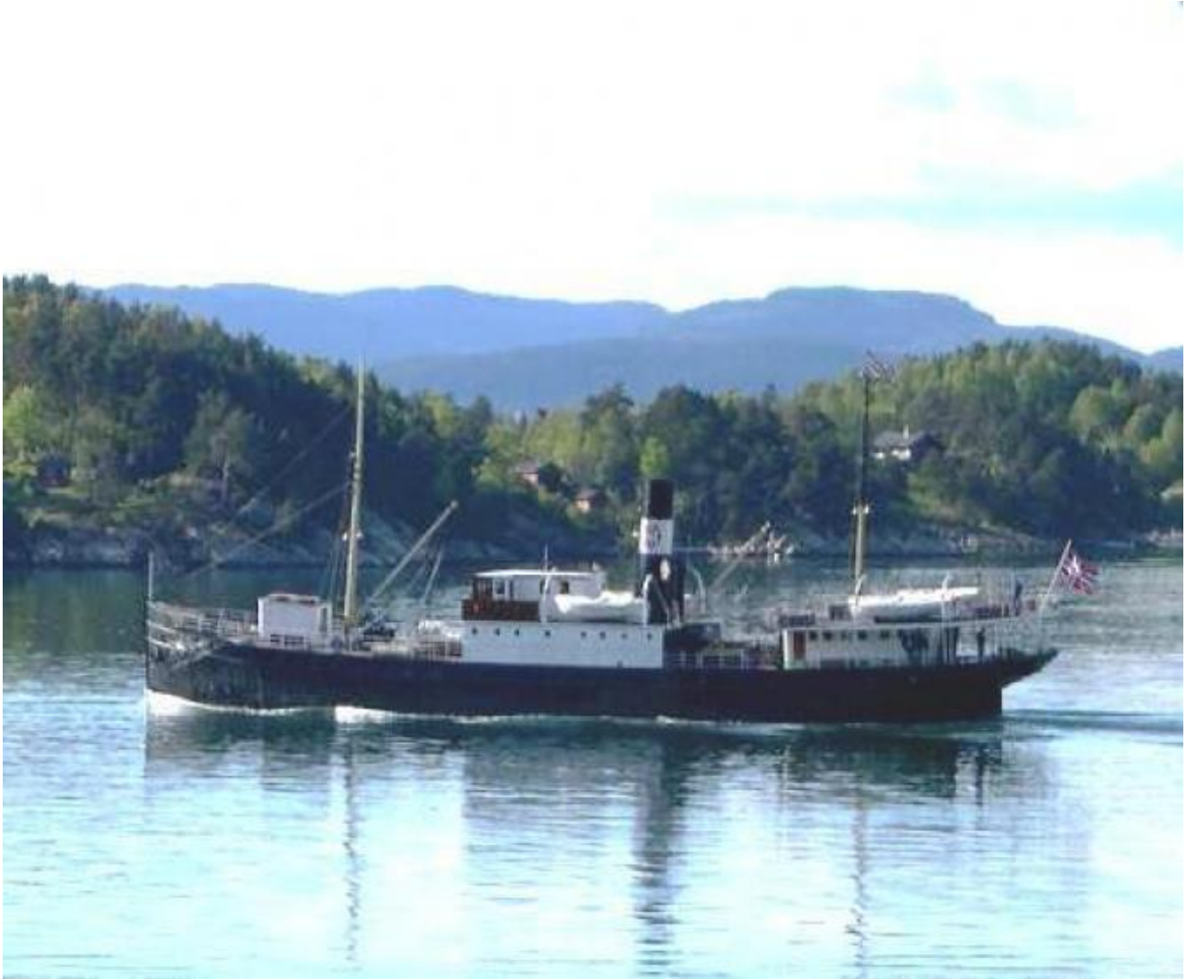
Stord I med Skorpo som bakgrunn torsdag ettermiddag.