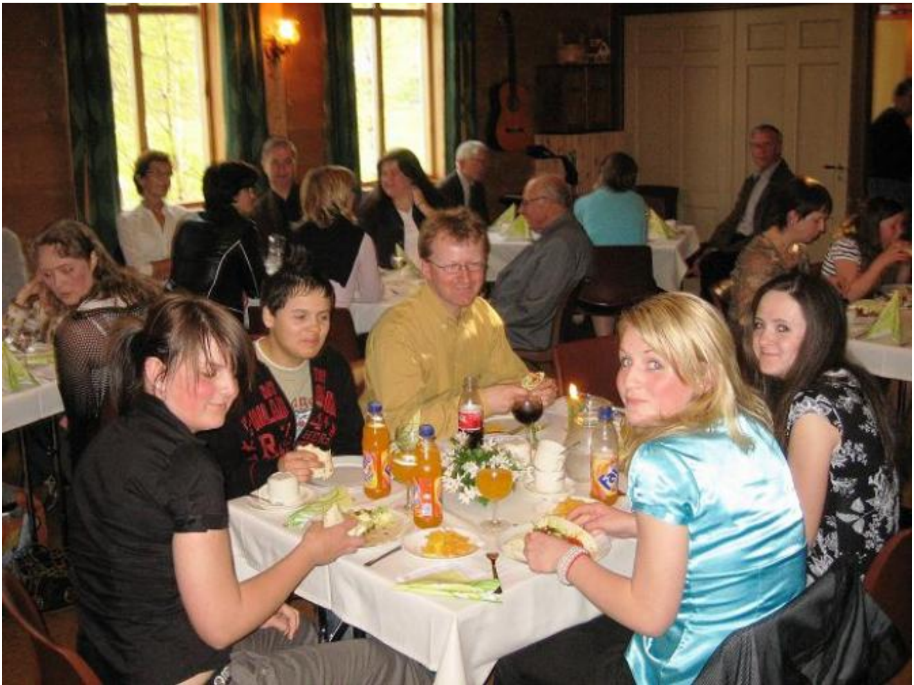
Det er berre fire konfirmantar i år, men festen for dei fylte bedehuset.