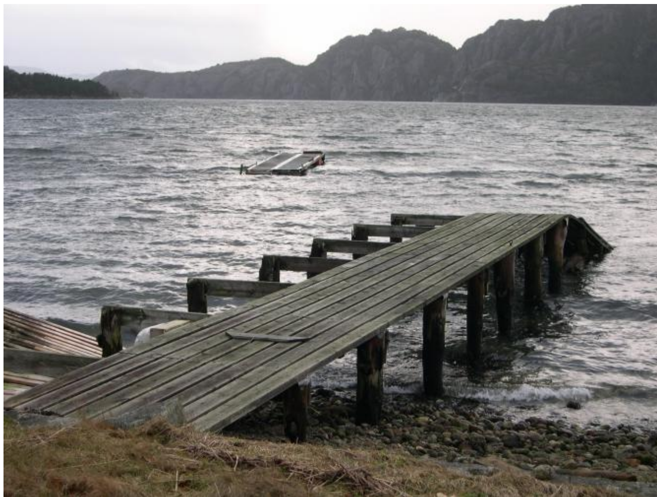
Lønningdalkaia syng no på siste verset – slik såg ho ut morgonen etter storstormen.

Ei kai i Uskedalen som gøymer mykje samferdsle-historie syng no på siste verset: Lønningdal-kaia fekk stygg medfart under den siste storstormen. Mange eldre uskedelingar har minner om både kaia og båtane som la til der.