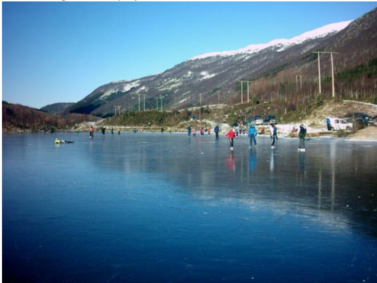
Fleire hadde funne vegen til Fjellandsbøvatnet idag.

I det flotte veret i helga har det vore gode muligheter for uteaktivitetar for både store og små. Mange har nytta høve til å ta turen til Fjellandsbøvatnet for å bruka isen. Både laurdag og søndag har det vore folksamt der. Det skjønar vi godt, for det var næraste perfekte forhold på og rundt dette idylliske fjellvatnet øvst i dalen vår.