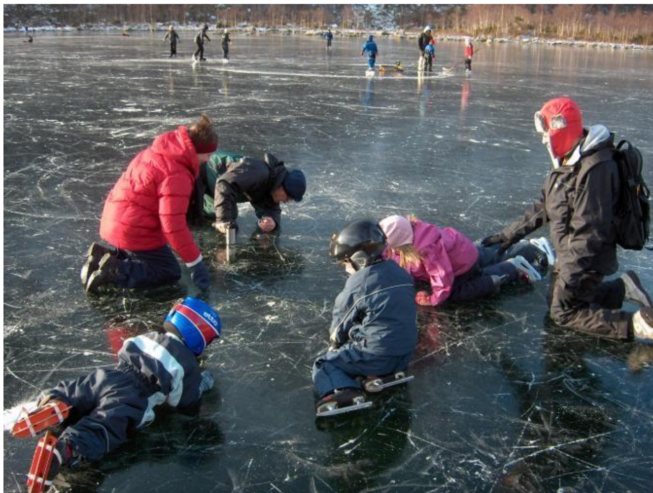
Kva er det som ligg under isen...?