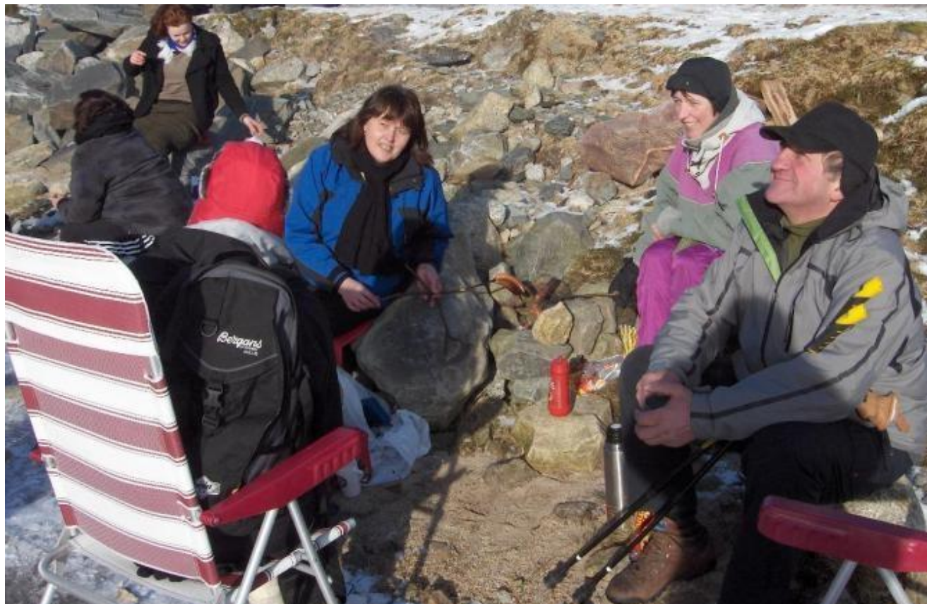
Det er vel lite som kan slå det å ete middagen ute.

...aha..Eit aldri så lite kunstverk. Nokon som har gløymd båten sin..