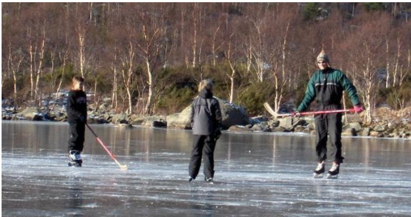
Ishockey er ein fast aktivitet på Fjellandsbøvatnet når isen er så fin som no!