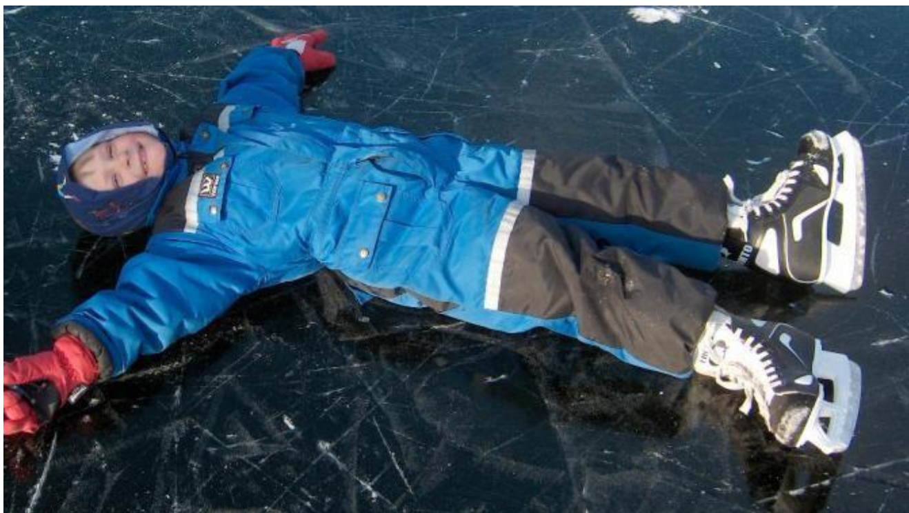
Men også dei som kan gå på skøyter får kjenne at isen er hard. -Eller er det ein liten pust i bakken?