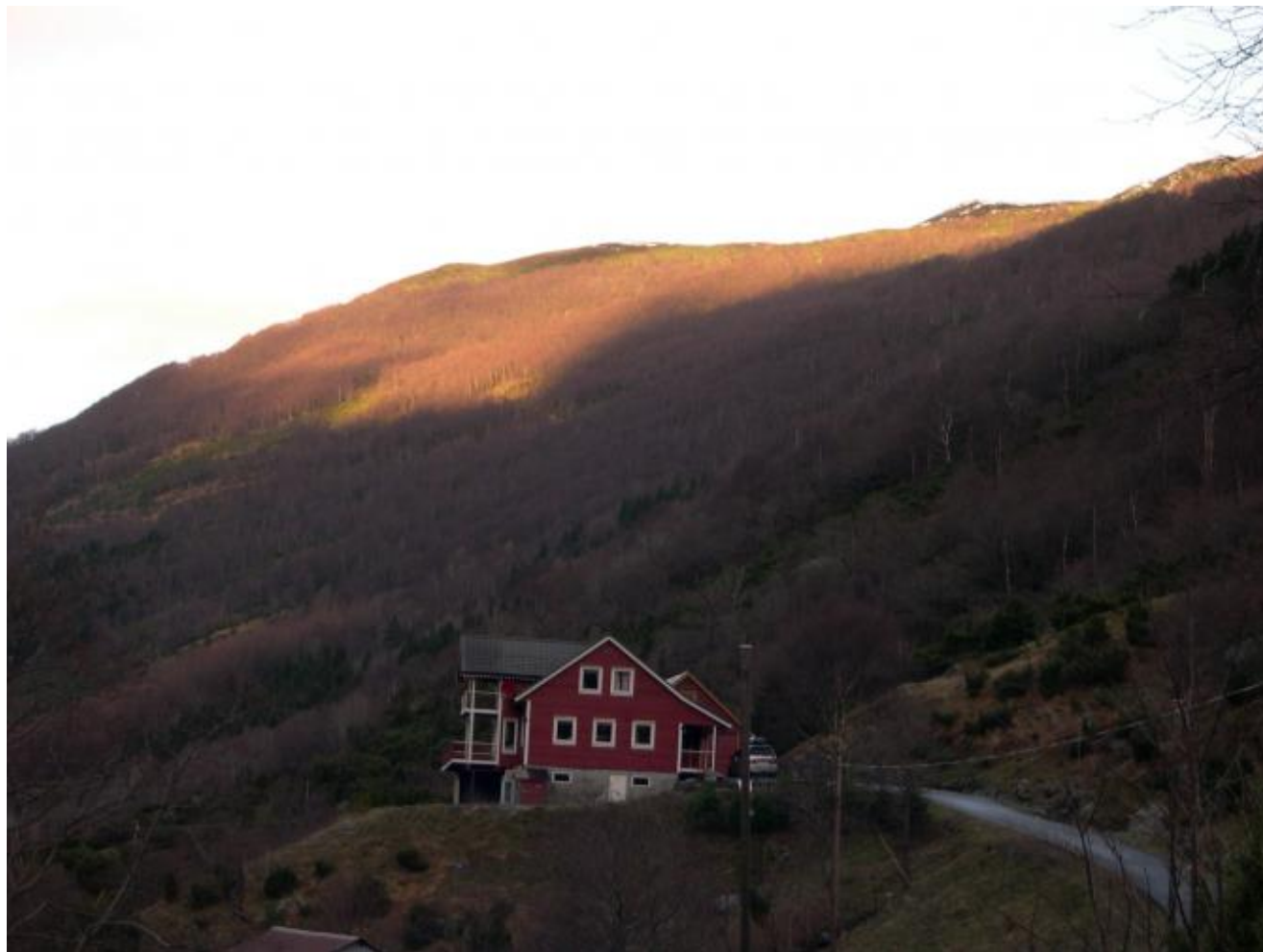
Solstref høgt over Musland like før solsnu. (Foto: Ola Matti Mathisen).

”Vintersolverv” står det på fredag 22. desember i den sjuande sansen vår. Det spelar eigentleg ikkje så stor rolle for dei som bor i dei sentrale delar av Uskedalen: Dei ser ikkje sola likevel denne dagen, for den er borte frå seks veker før solsnu til seks veker etterpå. Men dagen før dagen er likevel noko for seg sjøl, for den byr på fint ver og sol.