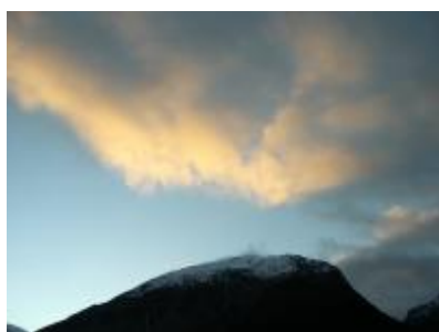
Sola gyller skyane over Englafjell 21. desember 2006.

”Vintersolverv” står det på fredag 22. desember i den sjuande sansen vår. Det spelar eigentleg ikkje så stor rolle for dei som bor i dei sentrale delar av Uskedalen: Dei ser ikkje sola likevel denne dagen, for den er borte frå seks veker før solsnu til seks veker etterpå. Men dagen før dagen er likevel noko for seg sjøl, for den byr på fint ver og sol.