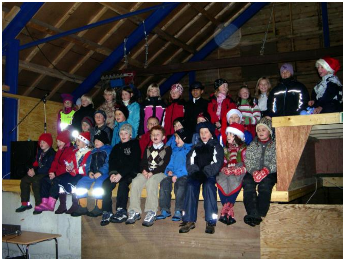
Andre, tredje og fjerde klasse song ein overraskande variant av musevisa.

Det heitte juleavslutning for skulen, men kunne og vore kalla juleopning for Uskedalen. Meir enn 250, det vil seia meir enn sin fjerdedel av innbyggjarane, toga gjennom ein alle av ljos frå bensinstasjonen til Dønhauglåven måndag ettermiddag. Og for ei juleopning det vart! Til og med Dønhaug-katten Brælo tok ivrig del i festen!