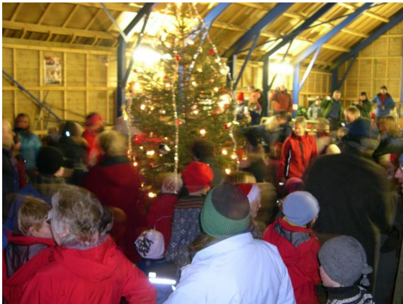
Og til slutt gjorde det godt med nokre rundar rundt juletreet.