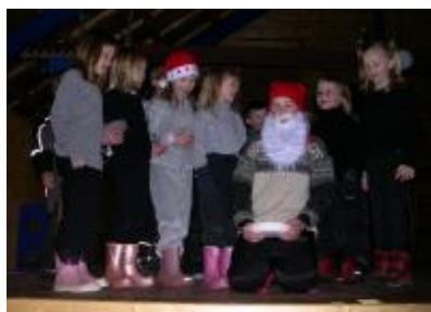
Førsteklassingane song "På låven sitter nissen".