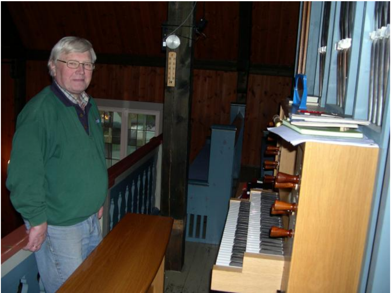
Kyrkjetenaren er glad for at orgelet er friskmeldt framfor julehelga.

Orgelet i Uskedalskyrkja har skranta litt i det siste, men no er det lukkelegvis friskmeldt framfor julehelga. Då skal det vera messe både julekvelden og 2. juledag og det er viktig at instrumentet ikkje gjev ulyder, men berre vellyd i frå seg.