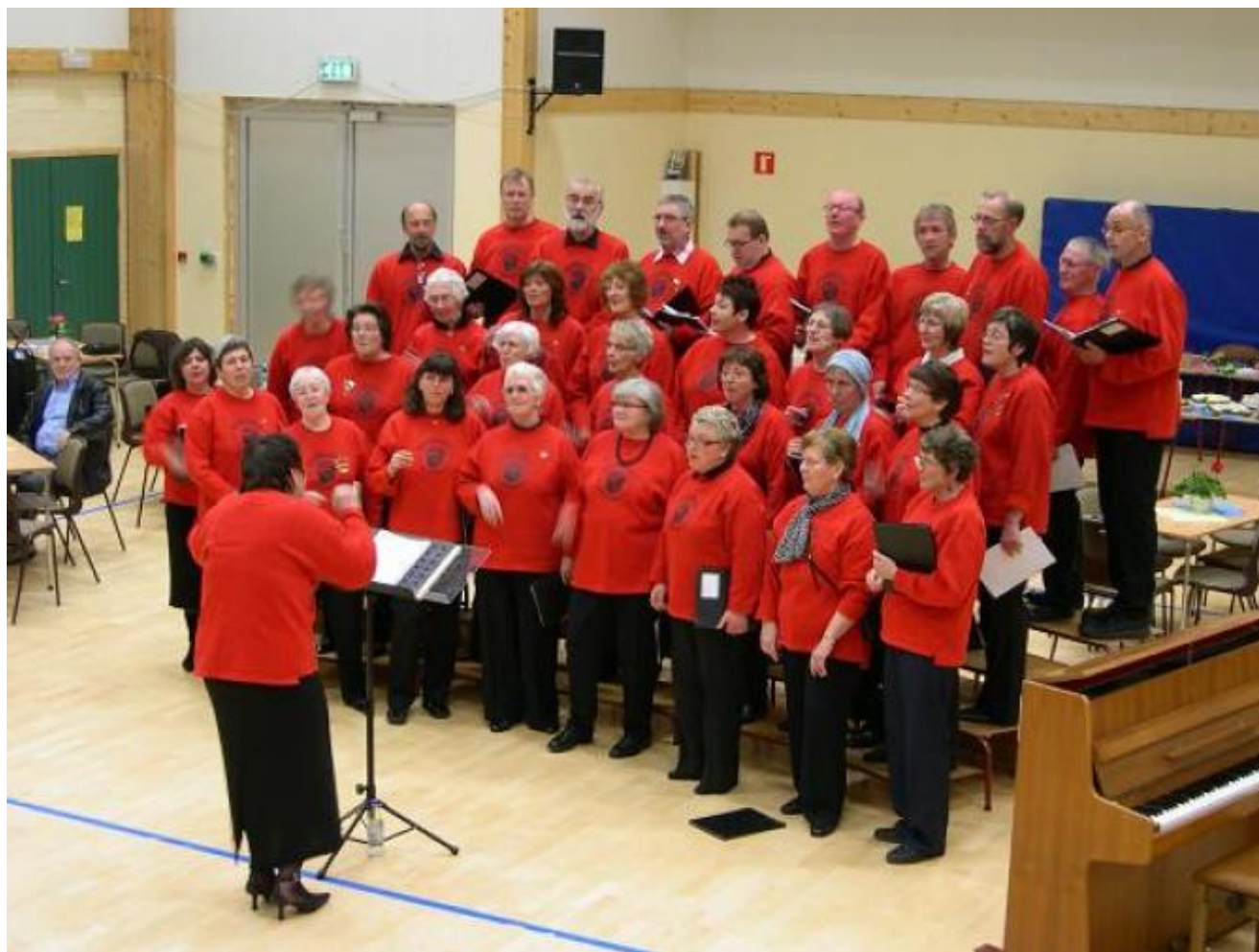
"Røysterett for alle" syng i Aktivitetshuset tidlegare i år – snart skal dei i elden i tre omgangar i Kulturhuset på Husnes. Først kjem to Sande-konsertar og i november kjem det lokale songarstemnet.